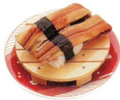
白木寿司皿 (B) (すべり止め付) 19-208-07 (30244) 950円 約φ11.7×H1.8cm