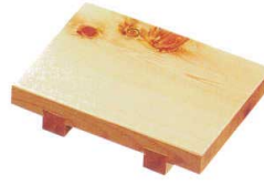
桧ミニ紅節長角盛台 (すべり止め付) 19-208-05 (30234) 1,100円 約12×9×H2.5cm