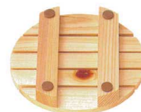
[すべり止め付] ※0.6を除く ご希望の場合はお問い合わせ下さい。