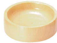
檜・丸小皿 19-208-03 (19208) 1,100円 約φ8.4×H3.2cm

おすすめのネタや自慢のネタをのせて。回転寿司の皿をはずしてもお使い頂けます。お盆にのせやすいミニサイズはランチセットに最適です。※回転寿司用樹脂皿はイメージです。