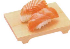
東濃檜・盛皿ミニ 19-208-06 (30351) 1,250円 約12×9×H2cm ※すべり止め加工はしてありません。