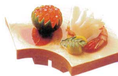
桧・紅節ミニ盛台 扇型 (すべり止め付) 19-208-08 (25759) 1,300円 約14.5×9.5×H2.5cm