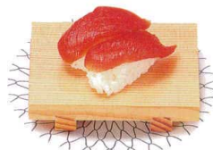
ミニ長角盛台 (すべり止め付) 19-208-04 (30235) 1,100円 約12×9×H2.5cm