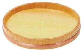
桶皿 6寸 積重 19-208-01 (31161) 4,950円 約φ18×H3cm / 内寸約φ16.2×H1.2cm ※ミガキ竹すだれ別売