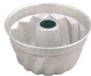
⑪ アルミ ネジレ菊 <WNZ-02>