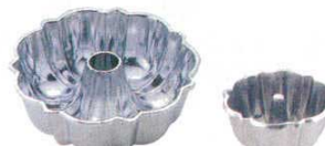
㉑ アルミダイカスト プディング型 <WPD-01> 目