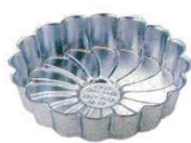
⑳ ギルア マルグリット型 <WML-06> 目