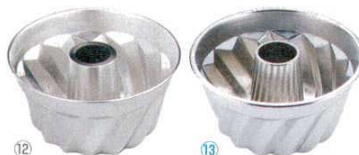
⑫ 18-8 クグロフ型 <WKG-01>