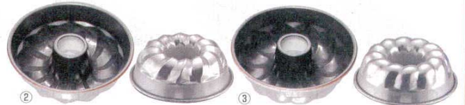
② アルミ ナノ・コーティング リングケーキ型