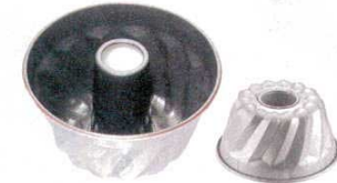
① アルミ ナノ・コーティング クグロフ型 <WKC-O4>