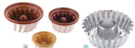
⑭ マトファ クグロフ陶器 <WKC-06> 目