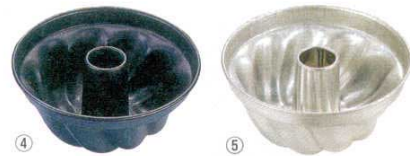
④ マトファ エグゾパン クグロフ <WKC-07>