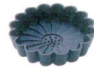
⑲ ブラックプリズム マルグリット型 No. 1250