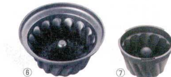
⑥ マトファ エグゾガラス クグロフ 345642 洗