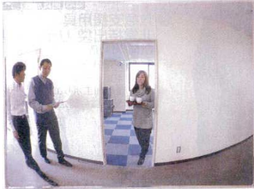
※写真はミラーに映った状況を表しています。