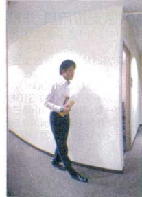
※写真はミラーに映った状況を表しています。

材質:ミラー/特殊プラスチック ベース/アルミニウム 厚さ:3.9mm ●T字路が多い病院・学校・工場などの人が行き交う場所に役立ちます。 ●ミラーに映る大きさは、大は小の約2倍です。 ※室内専用ですが、日光が当たる場所や高温・多湿の場所は設置できません。