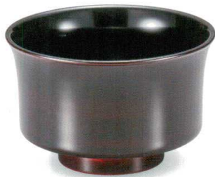
溜 椿 盃洗お好み椀 木合 漆 5105-03 ¥4,800 φ13.6×8.7 670ml 26-043