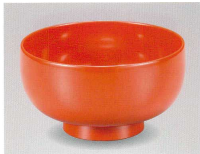
総朱 利休お好み椀 木合 漆 5105-04 ¥3,000 φ13.5×7.3 660ml 26-032