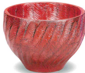
根来 楕円椀 (LL) 木 漆 輪 5105-08 ¥5,500 14.0×13.0×10.0 09-1062-2