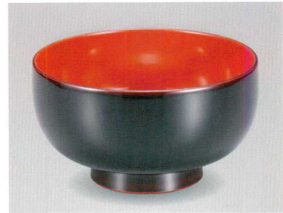
溜内朱 利休お好み椀 木合 漆 5105-05 ¥3,000 φ13.5×7.3 660ml 26-039