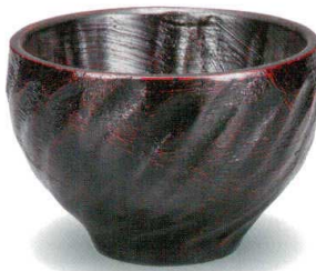
曙 楕円椀 (L) 木 漆 輪 5105-10 ¥4,300 13.0×12.5×9.0 09-1061-1