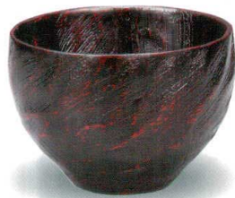
曙 楕円椀 (S) 木 漆 輪 5105-09 ¥3,500 11.5×10.6×8.0 09-1060-1