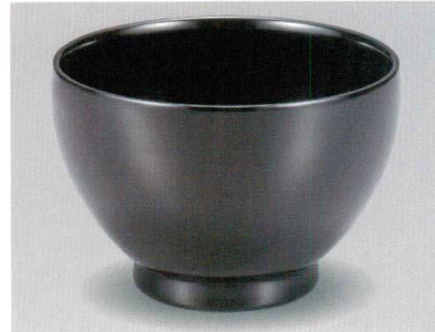
黒 45歳々杓 木合 漆 5105-02 ¥3,600 φ13.5×9.3 760ml 26-311