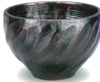
曙 楕円椀 (LL) 木 漆 輪 5105-11 ¥5,500 14.0×13.0×10.0 09-1062-1