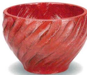
根来 楕円椀 (L) 木 漆 輪 5105-07 ¥4,300 13.0×12.5×9.0 09-1061-2