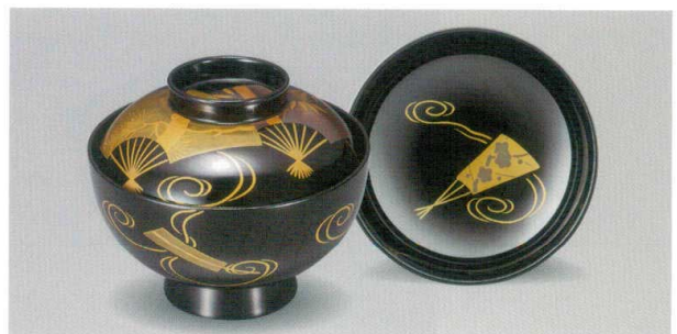
扇面 松竹梅 吸物椀 木合漆

5012-08 ¥38,000 φ12.0×10.0(7.0) 370ml 段無 11-0102