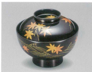
紅葉に水 吸物椀 木合漆

5012-02 ¥25,000 φ12.0×10.0(7.0) 370ml 段無 11-0157