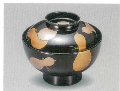
六瓢 吸物椀 木合漆

5012-03 ¥16,000 φ12.0×10.0(7.0) 370ml 段無 11-0107