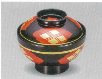
正法寺 吸物椀 木合漆

5012-05 ¥12,000 φ12.0×10.0(7.0) 370ml 段無 11-0116