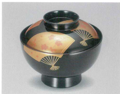
笹春秋 扇面 吸物椀 木合漆

5012-01 ¥39,000 φ12.0×10.0(7.0) 370ml 段無 11-0113