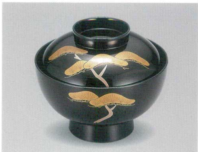
老松 吸物椀 木合漆

5012-04 ¥15,000 φ12.0×10.0(7.0) 370ml 段無 11-0111