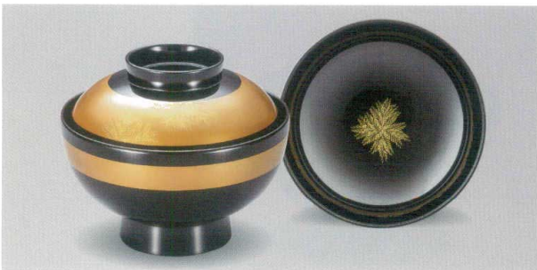
金帯 信夫沈金 吸物椀 木合漆

5012-07 ¥30,000 φ12.0×10.0(7.0) 370ml 段無 11-0152