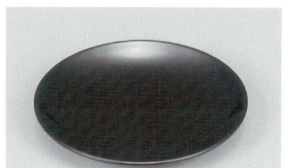
黒 50銘々皿 木合 漆 5124-06 ¥2,800 φ15.3×1.8 41-0110-50