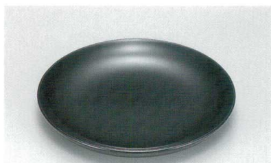
黒 45銘々皿 木 漆 5124-04 ¥6,000 φ13.7×2.0 40-0110-45