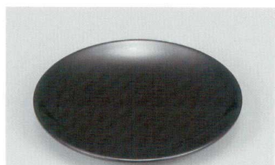
黒 50銘々皿 木合 漆 5124-06 ¥2,800 φ15.3×1.8 41-0110-50