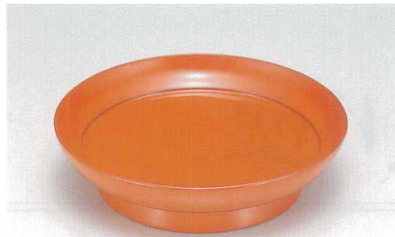
洗朱 楕皿 木 漆 5124-01 ¥12,000 φ14.0×3.7 40-052