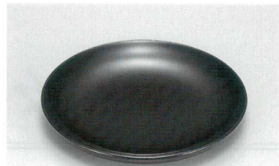
黒 50銘々皿 木 漆 5124-03 ¥7,200 φ15.0×2.2 40-0110-50