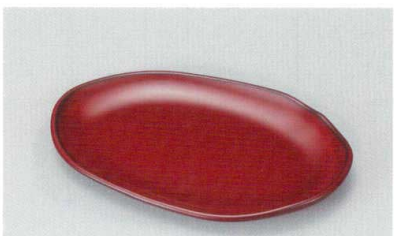
茜朱 手元皿 木合 漆 5124-12 ¥3,600 17.3×11.2×1.8 41-114 5124-13 ¥1,900 17.3×11.2×1.8 41-117