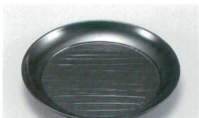
黒 刷毛目 55千家皿 木合 漆 5124-07 ¥4,500 φ16.4×2.3 41-4119-55