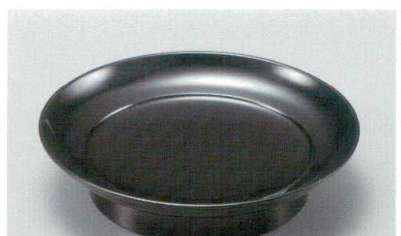
黒 45椿皿 木合 漆 5124-09 ¥3,000 φ13.8×3.2 41-311-45