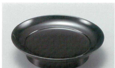
黒 45楕皿 木合 漆 5124-09 ¥3,000 φ13.8×3.2 41-311-45