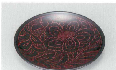
黒 牡丹彫 50銘々皿 木合 漆 5124-05 ¥4,800 φ15.3×1.8 41-0111-50