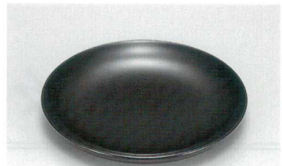
黒 50銘々皿 木 漆 5124-03 ¥7,200 φ15.0×2.2 40-0110-50