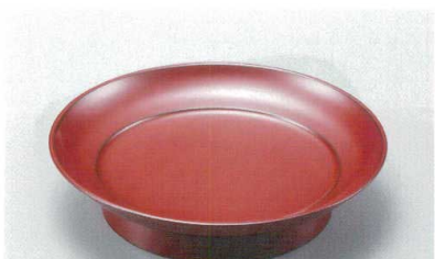
茜朱 椿皿 木合 漆 5124-10 4.5寸 ¥3,000 φ13.8×3.2 41-3121-45 5124-11 5寸 ¥3,800 φ15.0×3.8 41-3121-51