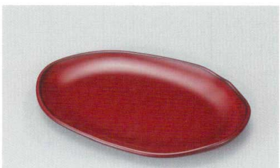
茜朱 手元皿 木合 漆 5124-12 ¥3,600 17.3×11.2×1.8 41-114 5124-13 ¥1,900 木合 硬 耐熱 17.3×11.2×1.8 41-117