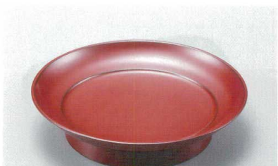
茜朱 楕皿 木合 漆 5124-10 4.5寸 ¥3,000 φ13.8×3.2 41-3121-45 5124-11 5寸 ¥3,800 φ15.0×3.8 41-3121-51