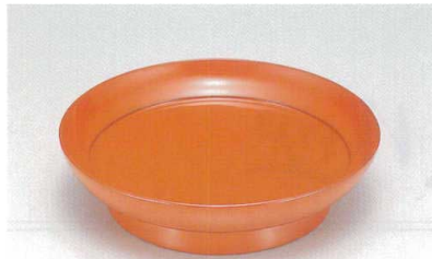
洗朱 椿皿 木 漆 5124-01 ¥12,000 φ14.0×3.7 40-052