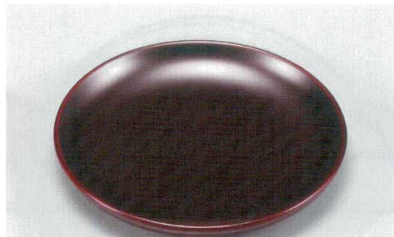
溜 50銘々皿 木 漆 5124-02 ¥7,200 φ15.0×2.2 40-0130-50