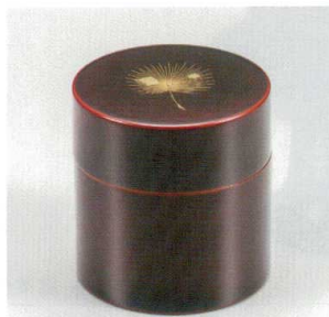
溜 飛花 茶筒 (中蓋付) 木合 漆 5130-06 ¥7,000 φ8.9×9.2 400ml 38-2731