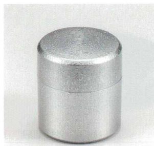
銀石目 小茶筒 (中蓋付) 木合 HC 5130-09 ¥3,000 φ7.4×8.2 200ml 38-229