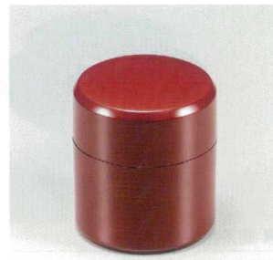
ウルミ 小茶筒 (中蓋付) 木合 ウ 5130-12 ¥2,200 φ7.4×8.2 200ml 38-225