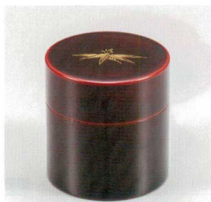
溜 笹絵 茶筒 (中蓋付) 木合 漆 5130-05 ¥7,000 φ8.9×9.2 400ml 38-2732