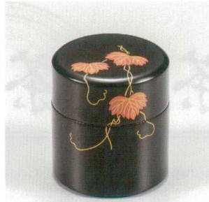
黒鳶 茶筒 (中蓋付) 木 漆 5130-03 ¥30,000 φ8.2×9.0 280ml 36-281-2