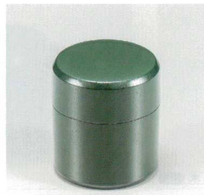
緑石目 小茶筒 (中蓋付) 木合 ウ 5130-11 ¥2,500 φ7.4×8.2 200ml 38-224