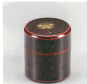
溜 飛花 小茶筒 (中蓋付) 木合 漆 5130-08 ¥6,500 φ7.4×8.2 200ml 38-2231