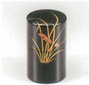
黒蘭 高茶筒 (中蓋付) 木 漆 5130-01 ¥38,000 φ7.5×12.0 230ml 36-282-2