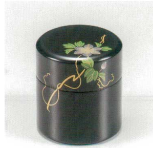
黒鉄線 茶筒 (中蓋付) 木 漆 5130-04 ¥30,000 φ8.2×9.0 280ml 36-281-1