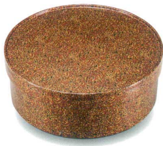
金虫 茶櫃 5130-13 9寸 φ27.0×11.6 (φ25.9×10.6) 38-212-09 ¥8,500 5130-14 11寸 φ33.5×12.8 (φ32.2×11.8) 38-212-11 ¥9,800