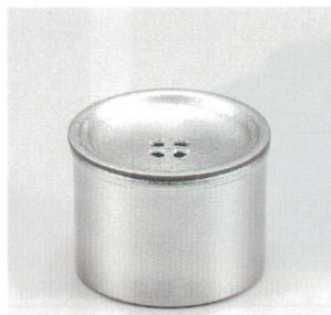
銀石目 小茶こぼし 木合 HC 5130-10 ¥2,400 φ8.0×6.0 80ml 38-299