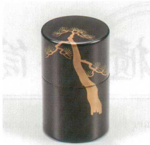
黒老松 高茶筒 (中蓋付) 木 漆 5130-02 ¥35,000 φ7.5×12.0 230ml 36-282-1