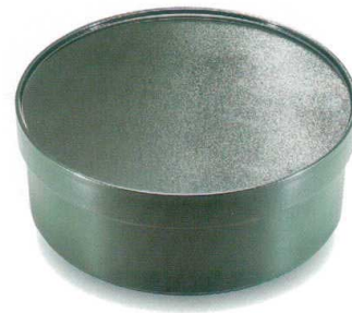
緑石目 茶櫃 5130-15 9寸 φ27.0×11.6 (φ25.9×10.6) 38-216-09 ¥5,500 5130-16 11寸 φ33.5×12.8 (φ32.2×11.8) 38-216-11 ¥7,000