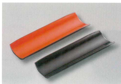
オシボリ入 木 漆 5142-03 朱 ¥8,000 18.1×5.8×1.9 76-012 5142-04 黒 ¥8,000 18.1×5.8×1.9 76-011