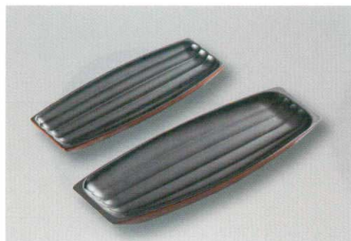
黒 笹オシボリ入 木 硬 5142-07 小 ¥7,500 15.3×5.8×1.4 76-036-1 5142-08 大 ¥8,000 20.1×7.5×1.5 76-036-2