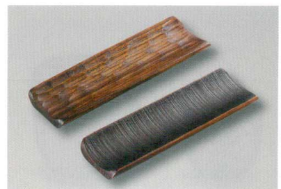
オシボリ入 木 漆 輪 5142-11 ノミ彫 ¥1,800 18.6×5.7×1.6 09-1125 5142-12 のこ目 ¥1,600 18.3×5.7×1.6 09-1126