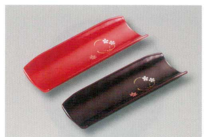
波花 オシボリ入 木 硬 漆 耐熱 5142-17 朱 ¥1,800 17.4×6.2×2.0 76-3172 5142-18 溜 ¥1,850 17.4×6.2×2.0 76-3181