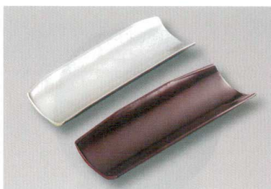
オシボリ入 5142-15 銀地 木 硬 漆 耐熱 ¥2,300 17.4×6.2×2.0 76-319 5142-16 溜 竹形 木 硬 漆 耐熱 ¥2,100 18.0×7.0×2.3 76-358