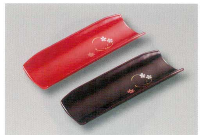
波花 オシボリ入 木 硬 漆 耐熱 5142-17 朱 ¥1,800 17.4×6.2×2.0 76-3172 5142-18 溜 ¥1,850 17.4×6.2×2.0 76-3181