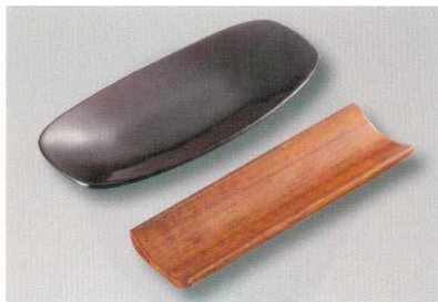
オシボリ入 5142-13 溜 福形 木 硬 漆 耐熱 ¥1,800 18.5×8.4×1.7 76-348 5142-14 摺漆 木 漆 輪 ¥1,500 18.5×5.6×1.5 09-1127