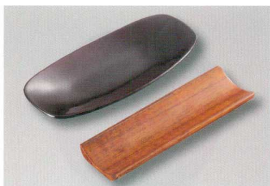
オシボリ入 5142-13 溜 福形 木 硬 漆 耐熱 ¥1,800 18.5×8.4×1.7 76-348 5142-14 摺漆 木 漆 輪 ¥1,500 18.5×5.6×1.5 09-1127