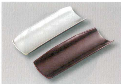
オシボリ入 5142-15 銀地 木 硬 漆 耐熱 ¥2,300 17.4×6.2×2.0 76-319 5142-16 溜 竹形 木 硬 漆 耐熱 ¥2,100 18.0×7.0×2.3 76-358