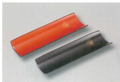
飛松沈金 オシボリ入 木 漆 5142-01 朱 ¥9,000 18.1×5.8×1.9 76-0121 5142-02 黒 ¥9,000 18.1×5.8×1.9 76-0111