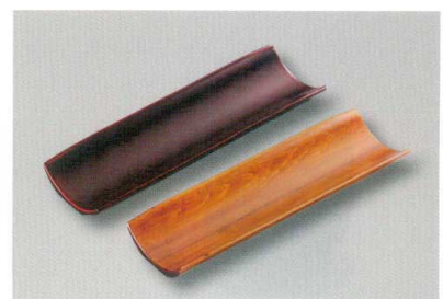
オシボリ入 木 漆 5142-05 溜 ¥8,000 18.1×5.8×1.9 76-013 5142-06 拭漆 ¥4,800 18.1×5.8×1.9 76-015