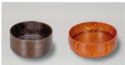
拭漆袴 木 漆 5145-16 酒用 千筋 ¥2,100 φ7.6×3.7 74-010-1 5145-17 兼用 太鼓 ¥3,000 φ9.2×3.0 74-060