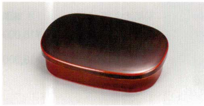
溜内朱 小判海苔入

5145-02 ¥5,000 13.6×9.2×3.4 (12.8×8.2×3.0) 75-713 5145-03 ¥3,000 13.6×9.2×3.4 (12.8×8.2×3.0) 75-718