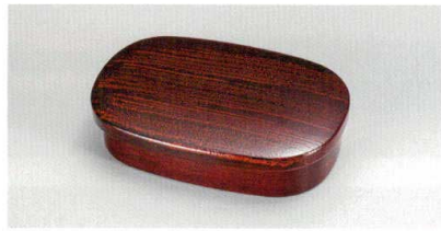
溜刷毛目内朱 小判海苔入 木 合 ウ 5145-08 ¥2,800 13.6×9.2×3.4 (12.8×8.2×3.0) 75-7191