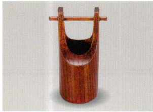
拭漆手桶 楊枝入 木 漆 輸 5145-01 ¥1,200 5.5×4.5×9.5 75-0001