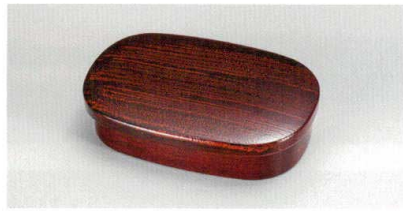
溜刷毛目内朱 小判海苔入

5145-07 ¥6,000 13.6×9.2×3.4 (12.8×8.2×3.0) 75-7136