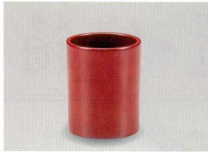
茜朱切立 楊枝入 (小) 木 合 漆 5138-08 ¥1,800 φ4.0×5.0 75-265-1