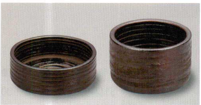
像谷袴 木 漆 5145-14 兼用 ¥3,300 φ9.2×3.0 74-059-1 5145-15 ビール用 ¥3,900 φ9.0×5.5 74-059-2