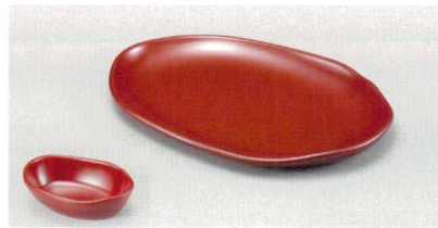
茜 30小判覗 木 合 硬 耐熱 5145-04 9.0×6.4×2.7 45-667-30 ¥1,200 茜朱 手元皿 木 合 硬 耐熱 5124-13 17.3×11.2×1.8 41-117 ¥1,900