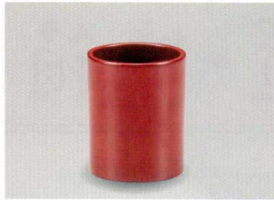
茜朱 切立 楊枝入 (小)