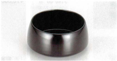
黒 腰丸 兼用袴

5145-09 ¥2,350 13.6×9.2×3.4 (12.8×8.2×3.0) 75-7192