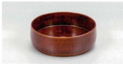
欅 木地呂 太鼓 兼用袴