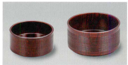
欅 木地呂 千筋袴

5145-12 酒用 ¥3,800 φ7.6×3.7 74-013-1 5145-13 兼用 ¥4,500 φ9.0×4.5 74-013-2