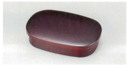
消溜内朱 小判海苔入 木 合 ウ 5145-09 ¥2,350 13.6×9.2×3.4 (12.8×8.2×3.0) 75-7192