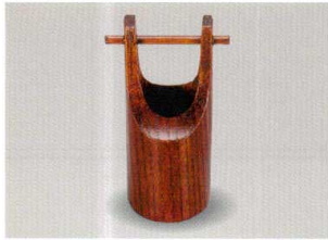
拭漆 手桶 楊枝入