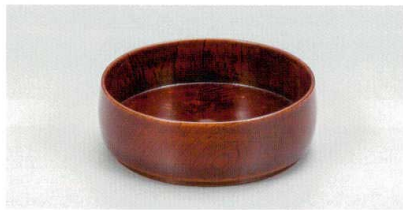
欅木地呂 太鼓 兼用袴 木 漆 5145-11 ¥4,500 φ9.2×3.0 74-065