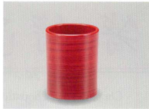
ワインかすり 切立 楊枝入 (小)