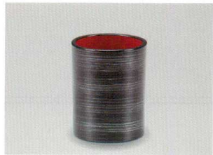
銀かすり 切立 楊枝入 (小)