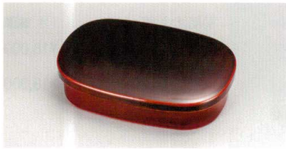
溜内朱 小判海苔入 木 合 漆 5145-02 ¥5,000 13.6×9.2×3.4 (12.8×8.2×3.0) 75-713 5145-03 木 合 硬 漆 耐熱 ¥3,000 13.6×9.2×3.4 (12.8×8.2×3.0) 75-718