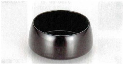
黒腰丸 兼用袴 木 漆 5145-10 ¥8,000 φ10.4×4.8 74-031