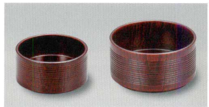
欅木地呂 千筋袴 木 漆 5145-12 酒用 ¥3,800 φ7.6×3.7 74-013-1 5145-13 兼用 ¥4,500 φ9.0×4.5 74-013-2