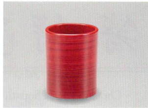
ワインかすり切立 楊枝入 (小) 木 合 ウ 耐熱 5138-12 ¥900 φ4.0×5.0 75-264-1