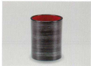
銀かすり切立 楊枝入 (小) 木 合 ウ 耐熱 5138-14 ¥900 φ4.0×5.0 75-266-1