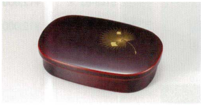
溜 飛花沈金 小判海苔入 木 合 漆 5145-07 ¥6,000 13.6×9.2×3.4 (12.8×8.2×3.0) 75-7136