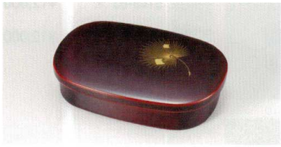
溜 飛花沈金 小判海苔入

5145-05 朱 ¥1,100 18.8×6.5×2.0 75-750-2 5145-06 黒 ¥1,000 18.8×6.5×2.0 75-750-1