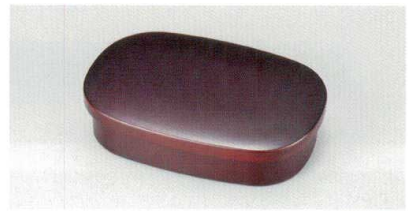
消溜内朱 小判海苔入

5145-08 ¥2,800 13.6×9.2×3.4 (12.8×8.2×3.0) 75-7191