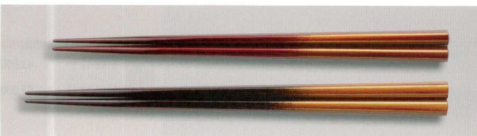
白檀 六角箸 木 MR漆 耐熱