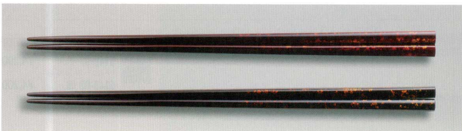
白檀 箔散 角箸 木 MR漆 耐熱