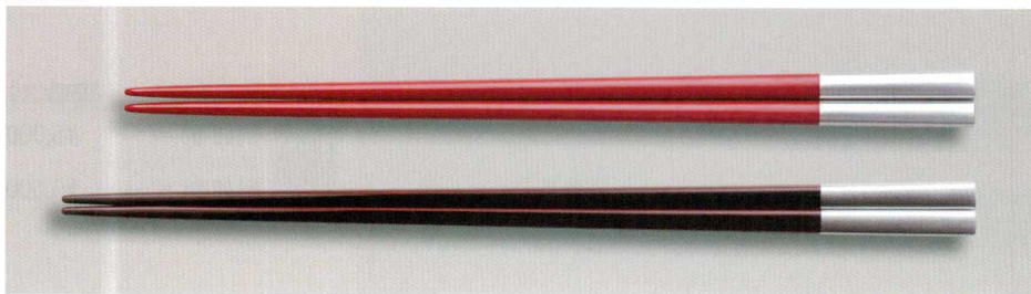
銀帯 角箸 木 MR漆 耐熱