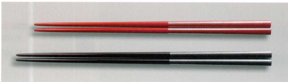
銀透し角箸 木 MR漆 耐熱