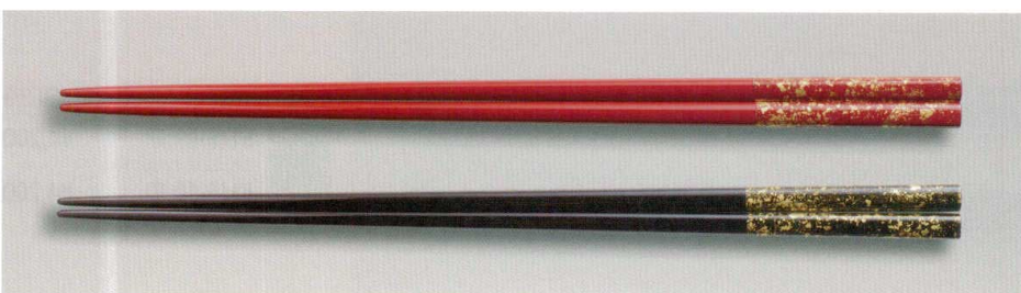
金箔散らし 角箸 木 MR漆 耐熱