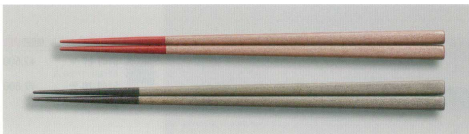
銀砂子ぼかし 角箸