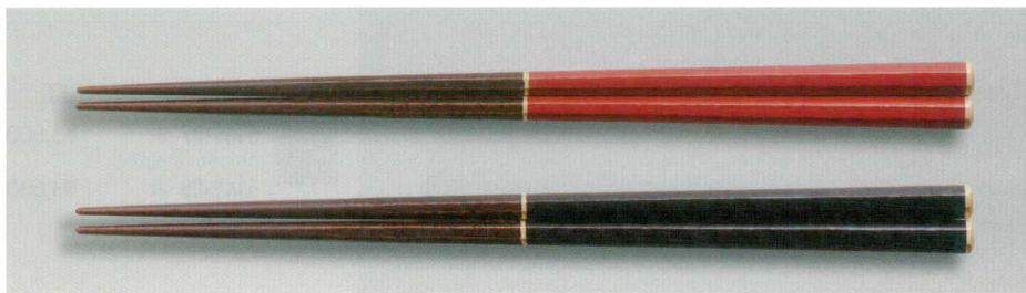
木地呂 塗り分 金線 八角箸