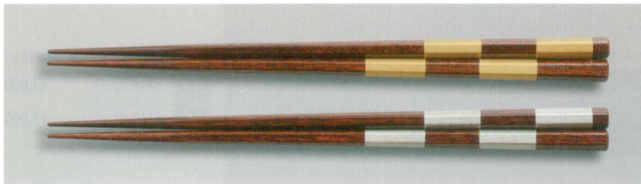
すり漆 格子 六角箸