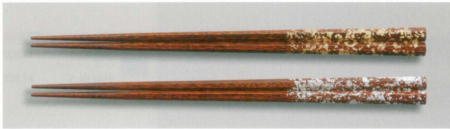
すり漆 箔散らし 八角箸