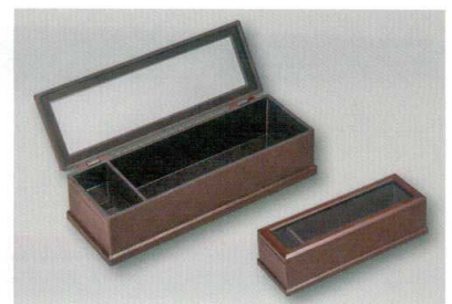
ウルミ 刷毛目 箸箱 (楊枝入付) A ウ 5154-29 ¥3,950 28.5×10.2×7.5 78-417