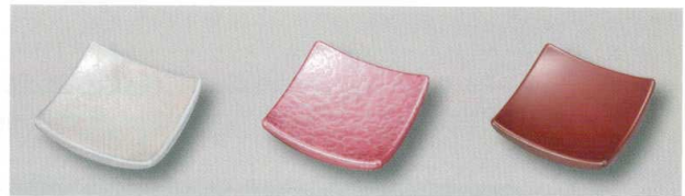
弥生箸置小皿 6.3×6.3×1.5 木合 耐熱 5154-04 HC ¥1,100 5154-05 HC ¥1,100 5154-06 硬 ¥800 ホワイトマリン 77-408-4 ピンクマリン 77-408-5 茜朱 77-408-7