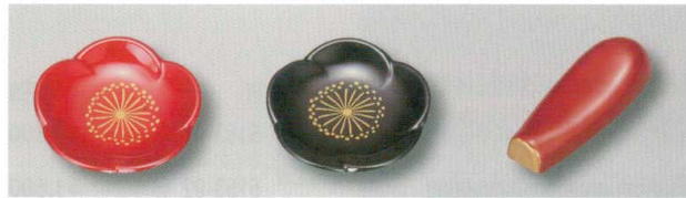
梅形 箸置 φ5.6×0.9 木合 硬 耐熱 朱 お多福箸置 木合 硬 耐熱 5154-01 ¥800 5154-02 ¥800 5154-03 6.6×2.5×1.2 ¥980 朱 77-403-2 黒 77-403-1 77-404