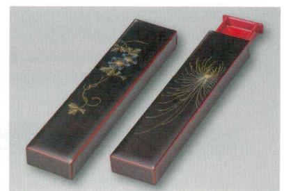
沈金 2膳入 箸箱 木 漆 5154-23 溜内朱 鉄線 ¥24,000 25.8×5.8×2.8 78-0232 5154-24 溜内朱 糸菊 ¥24,000 25.8×5.8×2.8 78-0231