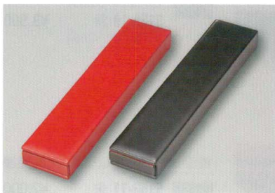
無地 2膳入 箸箱 木 漆 5154-25 総朱 ¥21,000 25.8×5.8×2.8 78-022 5154-26 黒内朱 ¥21,000 25.8×5.8×2.8 78-021