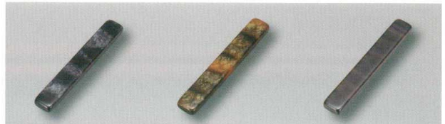
アセテート カトラリーレスト 9.8×1.5×0.6 77-410 5154-16 ¥850 5154-17 ¥850 5154-18 ¥850 青べっ甲 77-416-01 黄べっ甲 77-416-03 縞べっ甲 77-416-06