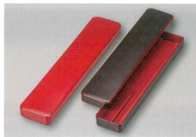
加伏 箸箱 (カトラリーボックス) 木合 漆 5154-27 総朱 ¥9,000 26.6×5.5×2.4 78-212 5154-28 溜内朱 ¥9,000 26.6×5.5×2.4 78-213