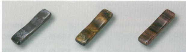
アセテート 箸置 6.0×1.5×0.6 77-410 5154-13 ¥800 5154-14 ¥800 5154-15 ¥800 青べっ甲 77-414-01 黄べっ甲 77-414-03 縞べっ甲 77-414-06