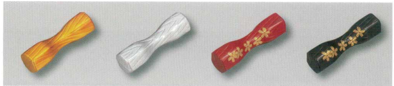
ツツミ形木目 箸置 1.6×5.6×1.5 樹 硬 耐熱 5154-09 ¥1,200 5154-10 ¥1,200 5154-11 ¥1,000 5154-12 ¥1,000 金地 77-413-3 銀地 77-413-4 朱 桜 77-413-21 黒 桜 77-413-11