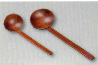
摺漆 お玉 (木) 漆 輪

5157-31 溜 白竹 ¥950 22.0×7.5×5.3 09-1020 5157-32 摺漆 穴明 ¥800 21.8×7.3×5.0 09-1029