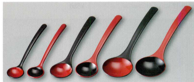
ピーナッツ Spoon (A) ウ お玉 Spoon (A) ウ

5157-17 黒内朱 ¥500 11.2×3.0×2.2 77-204-1 5157-18 朱内黒 ¥500 11.2×3.0×2.2 77-204-2 5157-19 黒内朱 (小) 16.3×5.0×5.3 77-222-1 ¥900 5157-20 朱内黒 (小) 16.3×5.0×5.3 77-222-2 ¥900 5157-21 黒内朱 (大) 19.2×6.0×4.6 77-221-1 ¥950 5157-22 朱内黒 (大) 19.2×6.0×4.6 77-221-2 ¥950