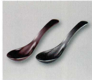
雅レンゲ (小) (TA) ウ 耐熱

5157-03 茜朱 ¥550 17.5×4.1×2.0 77-283-4 5157-04 黒 ¥550 17.5×4.1×2.0 77-283-5