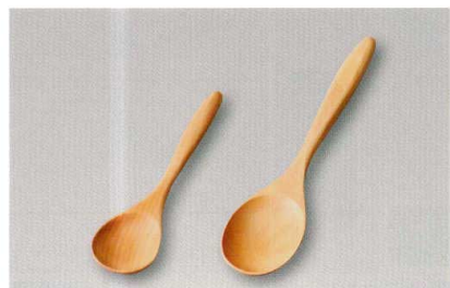
白木 Spoon (木) ウ 輪

5157-23 黒内朱 (小) 13.4×3.0×1.4 77-213-1 ¥580 5157-24 朱内黒 (小) 13.4×3.0×1.4 77-213-2 ¥580 5157-25 黒内朱 (大) 17.2×4.3×1.8 77-212-1 ¥650 5157-26 朱内黒 (大) 17.2×4.3×1.8 77-212-2 ¥650 5157-27 黒内朱 ¥880 20.1×5.8×2.0 77-211-1 5157-28 朱内黒 ¥880 20.1×5.8×2.0 77-211-2