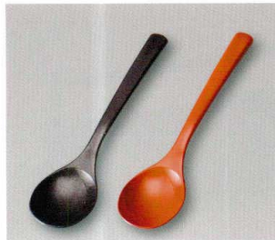
カレー Spoon (A) ウ

5157-01 黒銀地 ¥650 17.5×4.1×2.0 77-283-1 5157-02 洗朱 ¥550 17.5×4.1×2.0 77-283-3