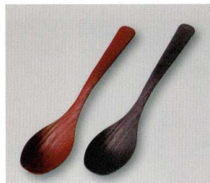
木目ディッシュ Spoon (TA) ウ 耐熱

5157-09 茜塗 ¥600 18.0×3.7×2.3 77-2081-92 5157-10 黒塗 ¥600 18.0×3.7×2.3 77-2081-91