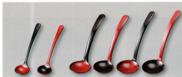
シュガー Spoon (A) ウ レードル Spoon (A) ウ

5157-15 黒内朱 ¥950 15.8×4.3×3.5 77-233-1 5157-16 朱内黒 ¥950 15.8×4.3×3.5 77-233-2