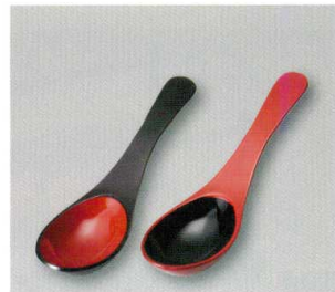
レンゲ (木) ウ 耐熱

5157-13 朱 ¥350 18.0×3.7×2.3 77-2080-2 5157-14 タモ ¥350 18.0×3.7×2.3 77-2080-4