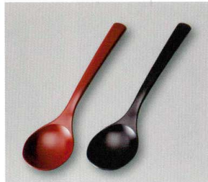
カレー Spoon (A) ウ

5157-01 黒銀地 ¥650 17.5×4.1×2.0 77-283-1 5157-02 洗朱 ¥550 17.5×4.1×2.0 77-283-3