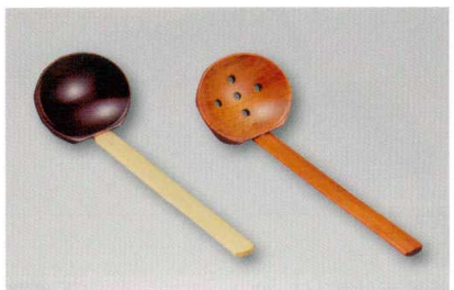
お玉 (木) 漆 輪

5157-29 小 ¥600 15.8×3.9×2.2 09-1052 5157-30 大 ¥950 22.3×5.6×1.8 09-1067