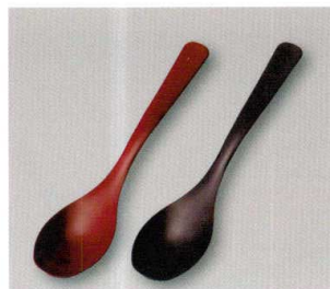
無地ディッシュ Spoon (TA) ウ 耐熱

5157-07 ウルミ ¥780 20.1×4.5×3.3 77-280-52 5157-08 黒銀地 ¥800 20.1×4.5×3.3 77-280-12