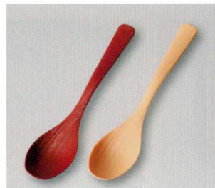
木目ディッシュ Spoon (TA) 耐熱

5157-11 茜塗 ¥600 18.0×3.7×2.3 77-2080-92 5157-12 黒塗 ¥600 18.0×3.7×2.3 77-2080-91