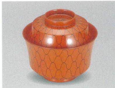
総朱 黒網目 石州吸物椀 木合 漆 5016-01 ¥12,000 φ11.0×9.7(7.0) 270ml 11-0622