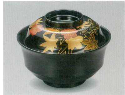
春秋 40天竜寺椀 木合 漆 5016-05 ¥13,000 φ12.2×8.8(5.8) 295ml 11-821-11