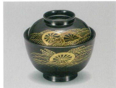
総黒 片車 吸物椀 木合 漆 5016-08 ¥5,700 φ11.5×10.2(7.3) 330ml 11-0817