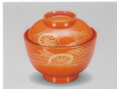
総朱 片車 吸物椀 木合 漆 5016-07 ¥6,000 φ11.5×10.2(7.3) 330ml 11-0824