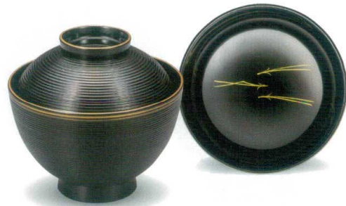
剥金 松葉 糸目吸物椀 木合 漆 5016-10 ¥6,500 φ11.0×10.1(7.3) 270ml 11-0711