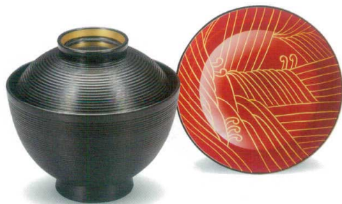
日の出立金 波 糸目吸物椀 木合 漆 5016-09 ¥8,500 φ11.0×10.1(7.3) 270ml 11-0743