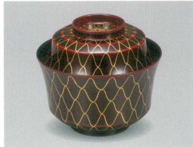
溜 金網目 石州吸物椀 木合 漆 5016-02 ¥16,500 φ11.0×9.7(7.0) 270ml 11-0633