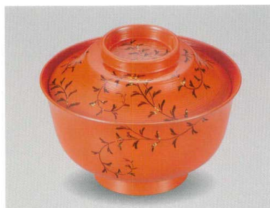
総朱刷毛目 唐草 42富士椀 木合 漆 5016-06 ¥11,000 φ12.0×8.8(6.5) 380ml 段無 11-5451