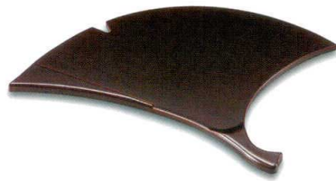
溜(漆風塗)裏黒 銀杏皿