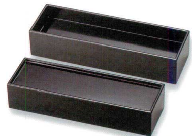
総黒 両面使い 長角盛器