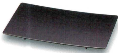
総黒真塗 90広幅足付皿