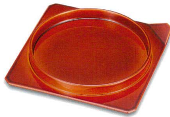
春慶(漆風塗)裏黒 葵皿