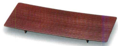
総溜 90細幅へぎメ足付皿