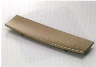
銀刷毛目裏黒 10付出皿 [木合 HC 耐熱]