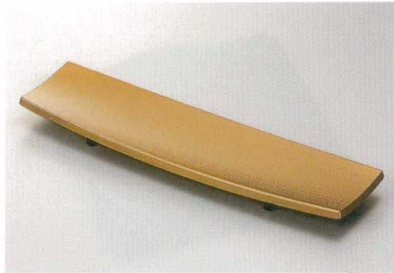
金刷毛目裏黒 10付出皿 [木合 HC 耐熱]