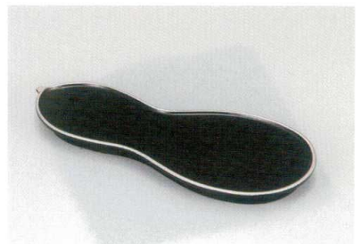
黒洩銀裏黒 瓢箪皿 [木合 硬 耐熱]