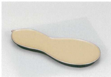
白洩銀裏黒 瓢箪皿 [木合 硬 耐熱]