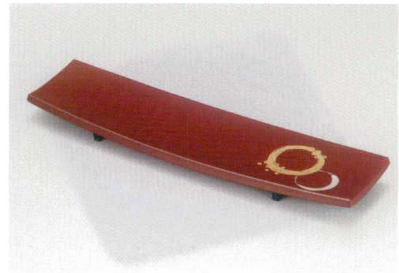
茜朱裏黒 波頭 10付出皿 [木合 ウ 耐熱]