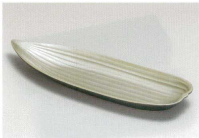
箔銀地裏黒 10笹皿 [木合 HC 耐熱]