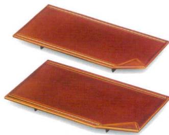
春慶(漆風塗)裏黒 隅折皿 [A SH]

5166-10 6寸 ¥2,300 18.0×12.0×1.5 45-308-60 5166-11 8寸 ¥3,600 24.3×16.4×1.8 45-308-80