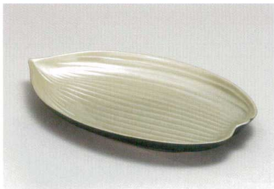
箔銀地裏黒 85笹皿 [木合 HC 耐熱]