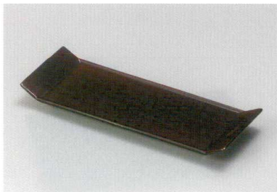
溜裏黒 77二方折皿 [樹 硬漆 耐熱]