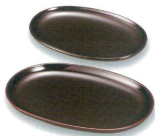
総溜 小判皿 [木合 硬漆 耐熱]

5166-10 6寸 ¥2,300 18.0×12.0×1.5 45-308-60 5166-11 8寸 ¥3,600 24.3×16.4×1.8 45-308-80