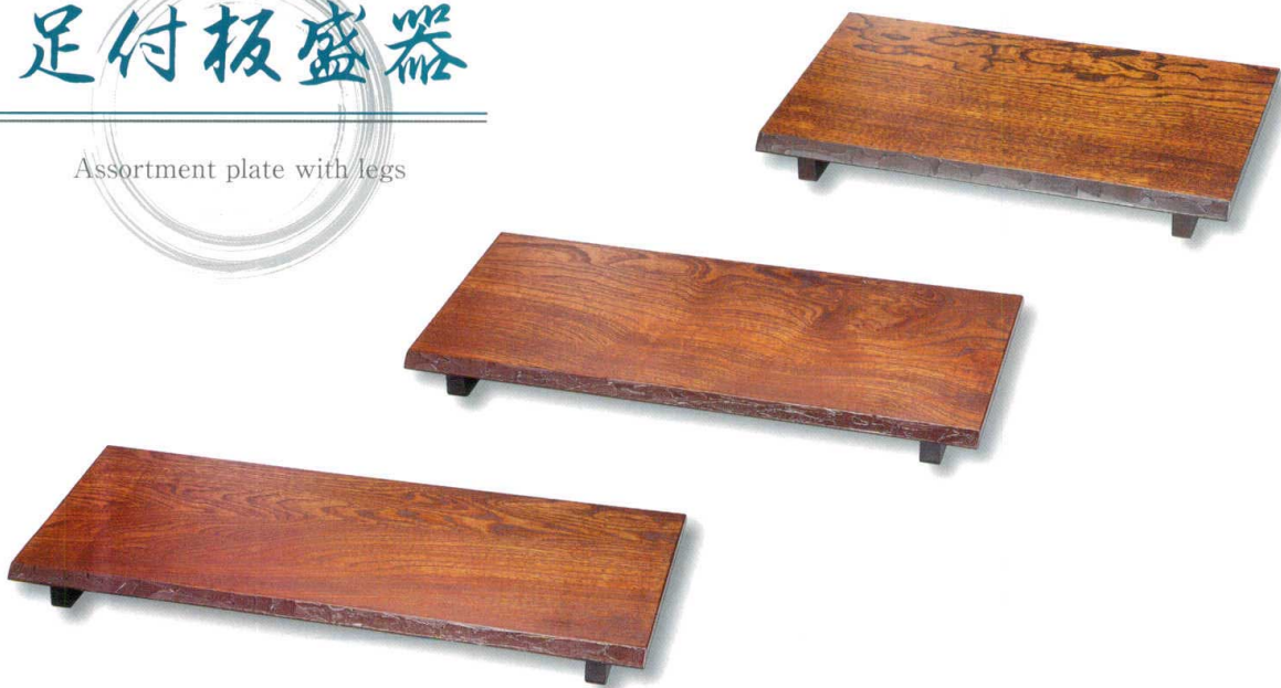
拭漆 面樺皮塗 足付板盛器