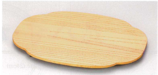
杉 木瓜足付 盛器