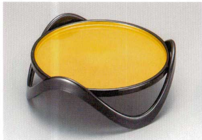
金梨地 凡情盛器 (足付)