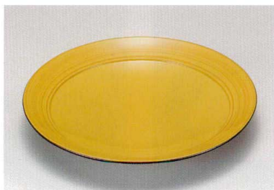
白木目裏黒 葵丸皿