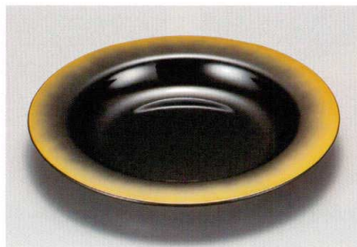
金銀ぼかし裏黒 80深皿