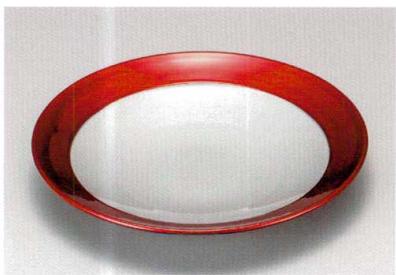
銀地帯ワイン (漆風塗) 裏黒 葵丸皿