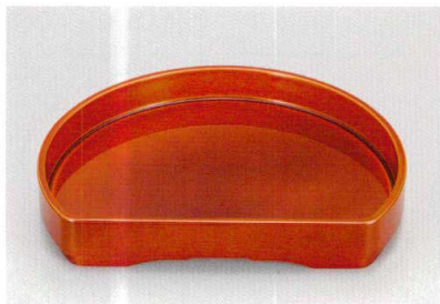
春慶 (漆風塗) 裏黒 80半月 盛器