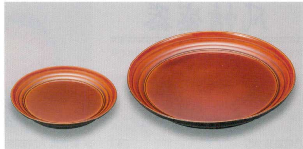
春慶 (漆風塗) 裏黒 さざ波皿