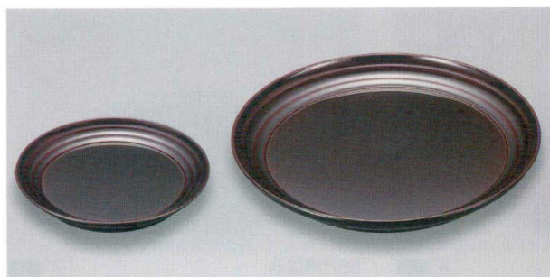
溜 (漆風塗) 裏黒 さざ波皿