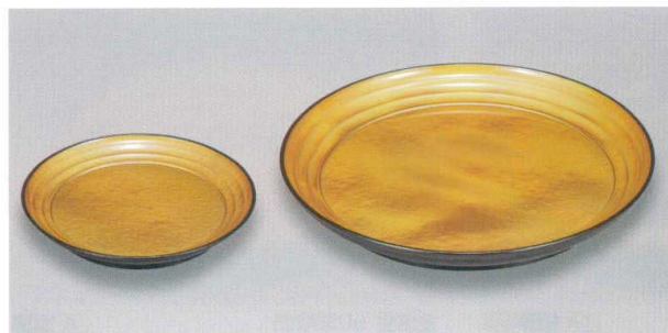
金瑞雲 (漆風塗) 裏黒 さざ波皿