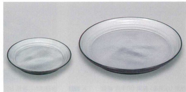
銀瑞雲 (漆風塗) 裏黒 さざ波皿