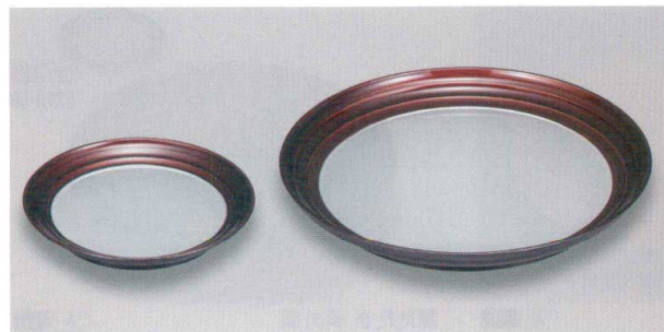
銀地帯溜 さざ波皿