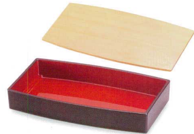
溜内朱 (漆風塗) 裏黒 胴張箱重 (TA) SH 耐熱