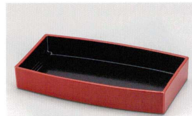
朱内裏黒 胴張箱重 (TA) ウ 耐熱