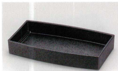
総黒石目 胴張箱重 (TA) HC 耐熱