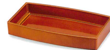
総春慶 (漆風塗) 裏黒 胴張箱重 (TA) SH 耐熱