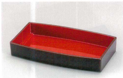
溜内朱 漆塗り裏黒 胴張箱重