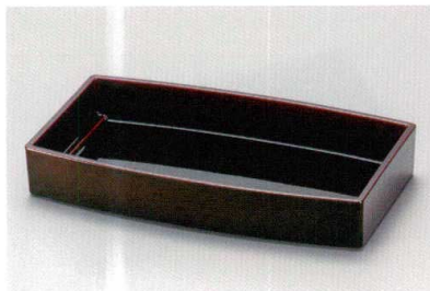
総溜 (漆風塗) 裏黒 胴張箱重 (TA) SH 耐熱