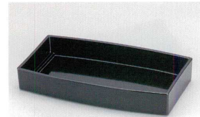
黒 胴張箱重 (TA) ウ 耐熱