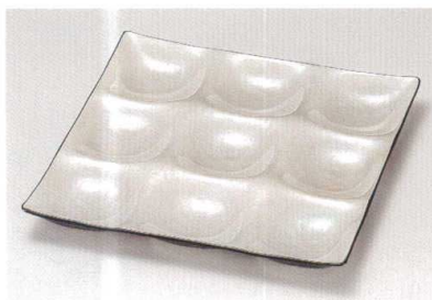
ホワイトマリン ナイン・プレート A HC