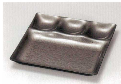
ブラックマリン スリーコンピ・プレート A HC