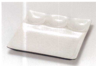
ホワイトマリン スリーコンピ・プレート A HC