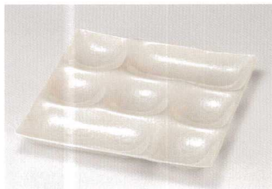
ホワイトマリン セブン・プレート A HC