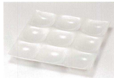
総ホワイト ナイン・プレート A ウ