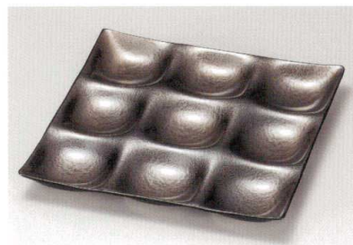
ブラックマリン ナイン・プレート A HC