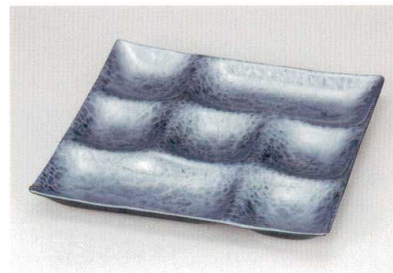
ブラックマリン セブン・プレート A HC