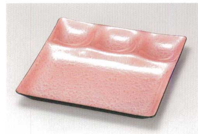
ピンクマリン スリーコンピ・プレート A HC