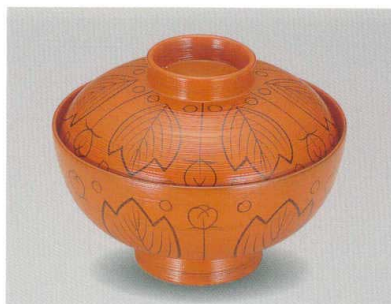
総朱刷毛目 吉野絵 40吸物椀