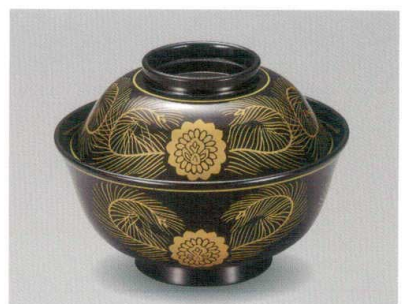
総黒 金蘭 羽反吸物椀