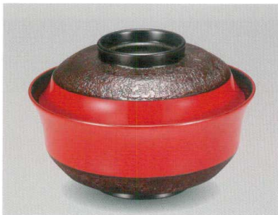
朱塗分櫨皮 天竜寺椀