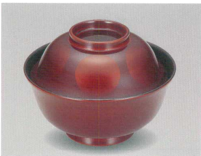
白檀日月 羽反吸物椀