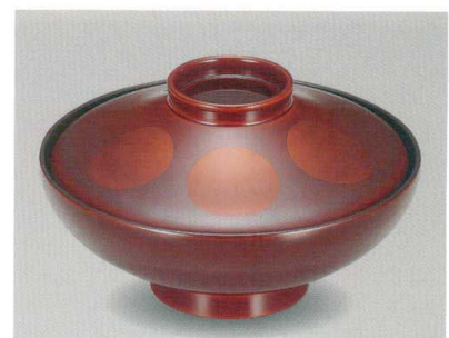
白檀日月 45平富士椀