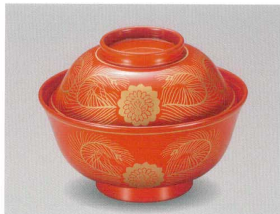
総朱 金蘭 羽反吸物椀