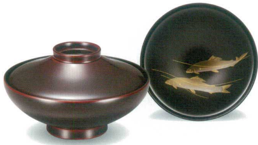
溜 見返鮎 45平富士椀