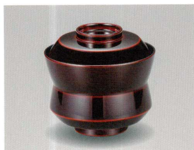
溜内黒 杵形吸物椀 木合 漆 ¥4,500 5023-06 φ10.3×9.5(7.4) 355ml 段無 11-273