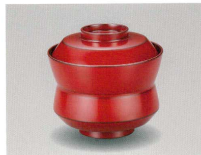
総茜朱 杵形椀 木合 漆 ¥4,300 5023-07 φ10.3×9.5(7.4) 355ml 段無 11-274