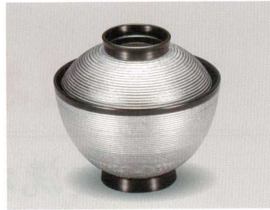
銀箔 糸目吸物椀 木合 漆 ¥9,500 5023-02 φ11.0×10.1(7.3) 270ml 11-0714