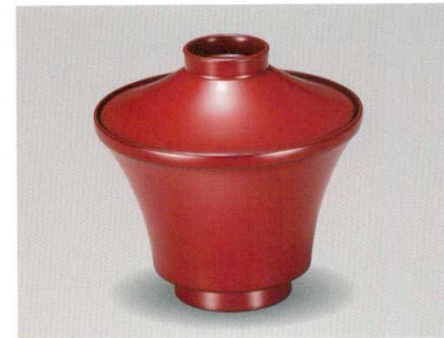
総茜朱 富士形吸物椀 木合 漆 ¥4,100 5023-08 φ10.5×10.1(7.5) 255ml 11-572