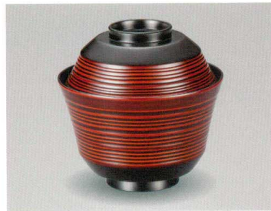
溜塗分 乱青椀 木合 漆 ¥4,400 5023-04 φ11.0×10.6(7.3) 295ml 11-783