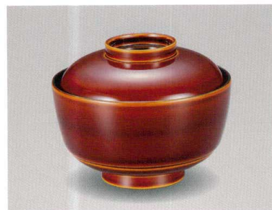
春慶 松川椀 木合 漆 ¥4,200 5023-09 φ11.0×8.6(6.2) 310ml 11-234