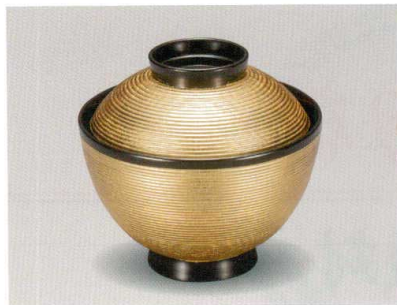
金箔 糸目吸物椀 木合 漆 ¥10,000 5023-01 φ11.0×10.1(7.3) 270ml 11-0713