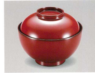
総茜朱 古仙才椀 木合 漆 ¥4,200 5023-11 φ10.6×8.6(7.5) 170ml 15-805-1