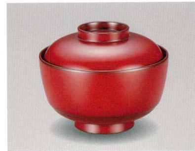
茜朱 松川椀 木合 漆 ¥3,900 5023-10 φ11.0×8.6(6.2) 310ml 11-232