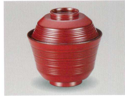
総茜朱 乱青椀 木合 漆 ¥4,200 5023-05 φ11.0×10.6(7.3) 295ml 11-782