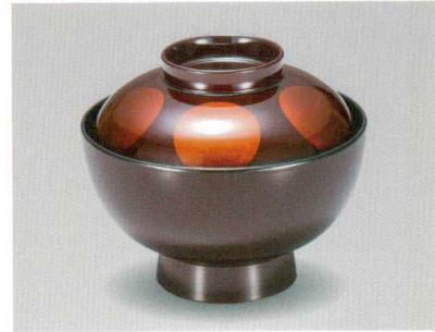
白檀日月 仙才吸物椀 木合 硬漆 耐熱 5025-05 ¥3,400 φ11.8×10.1(7.0) 270ml 13-0751