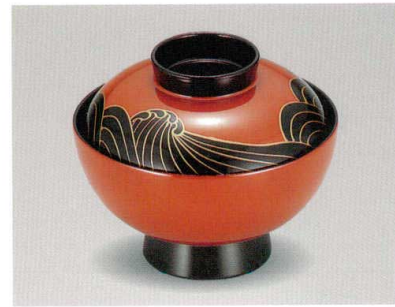
朱 波絵 吸物椀 TA ウ 耐熱 5025-10 ¥3,800 φ12.0×10.2(6.8) 350ml 段無 11-1271