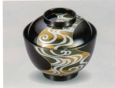
総黒 光琳水絵 38吸物椀 木合 HC 耐熱 5025-02 ¥5,000 φ11.5×10.2(7.3) 330ml 11-0862