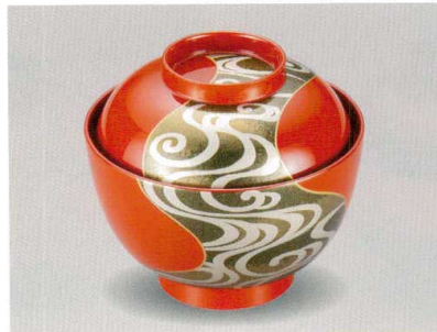
総朱 光琳水絵 38吸物椀 木合 HC 耐熱 5025-01 ¥5,000 φ11.5×10.2(7.3) 330ml 11-0871