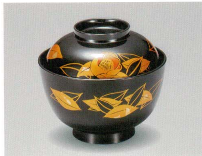
箔 山茶花 38吸物椀 木合 HC 耐熱 5025-04 ¥4,300 φ11.5×10.2(7.3) 330ml 11-0864