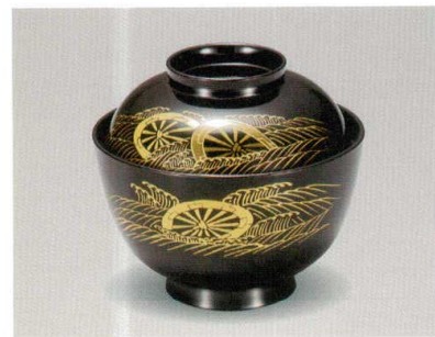
黒 片車 38吸物椀 木合 硬 耐熱 5025-09 ¥3,500 φ11.5×10.2(7.3) 330ml 11-0861