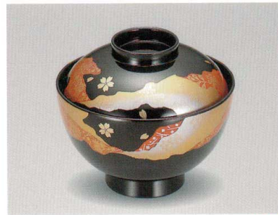
王朝絵 京形吸物椀 木合 HC 耐熱 5025-07 ¥4,800 φ11.2×9.8(7.0) 285ml 11-822-01