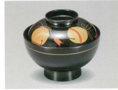
鈴 金ライン 吸物椀 木合 HC 耐熱 5025-11 ¥3,600 φ11.8×10.1(7.0) 270ml 13-0764