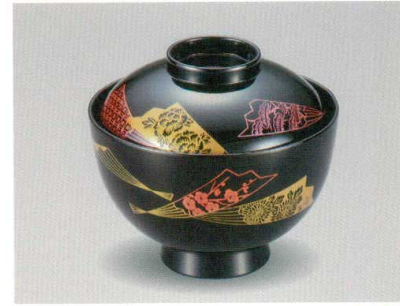
帯扇面 京形吸物椀 木合 HC 耐熱 5025-08 ¥3,900 φ11.2×9.8(7.0) 285ml 11-822-03