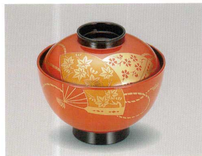
朱 扇に結び 京形吸物椀 木合 HC 耐熱 5025-06 ¥5,000 φ11.2×9.8(7.0) 285ml 11-822-04