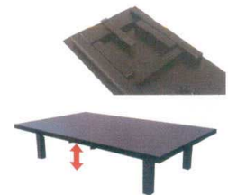
和座卓としての使用例