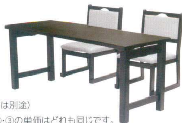
H足膳 洋での使用例 (椅子は別途)

※H足膳、U足膳、天板①・②・③の単価はどれも同じです。 ご希望の足膳、天板①・②・③をご指示下さい。