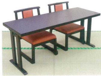
二人横並び 漆遊膳 洋での使用例 (椅子は別途)