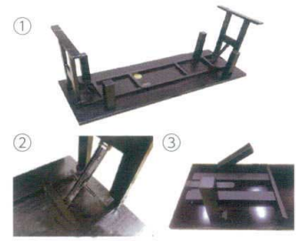
和洋兼用膳の足の置み方