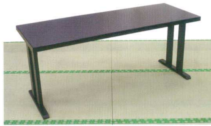
三人横並び 漆遊膳 洋での使用例 (椅子は別途)