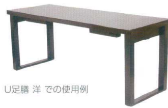
U足膳 洋での使用例

※H足膳、U足膳、天板①・②・③の単価はどれも同じです。 ご希望の足膳、天板①・②・③をご指示下さい。