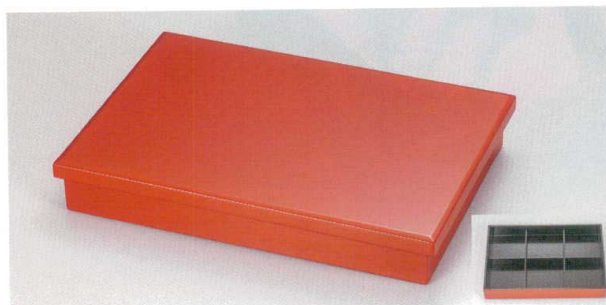
朱内黒 13長手松花堂 (六ツ仕切付)