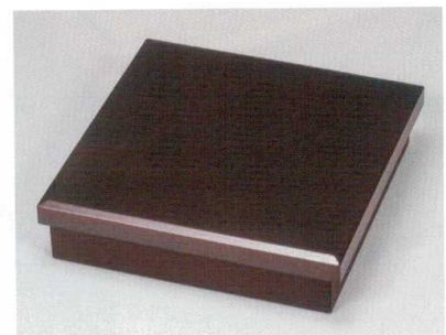
溜内黒 85松花堂 (十字仕切付) [木] 硬