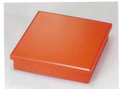
朱内黒へぎ目 85松花堂 (十字仕切付) [木] 硬