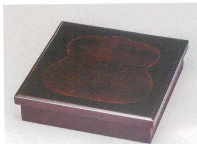
曙内黒 瓢箪 85松花堂 (十字仕切付) [木] 硬