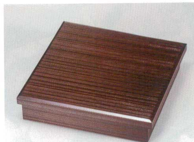
総紅溜へぎ目 85松花堂 (十字仕切付) [木] 硬