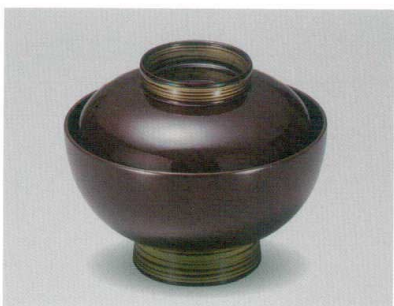
溜 金冠 仙才吸物椀 木合 硬 耐熱

5026-07 ¥2,500 φ11.8×10.1(7.0) 270ml 13-0794