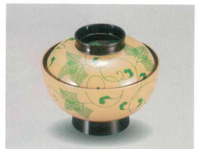
白 緑シダ唐草 吸物椀 木合 HC 耐熱

5026-02 ¥3,200 φ11.0×10.3(7.2) 320ml 13-1661