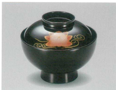
蓮 仙才吸物椀 木合 HC 耐熱

5026-04 ¥3,950 φ12.0×10.0(7.0) 370ml 段無 11-0191