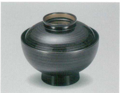
黒銀かすり 立金 吸物椀 木合 HC 耐熱

5026-06 ¥2,600 φ11.8×10.1(7.0) 270ml 13-0793