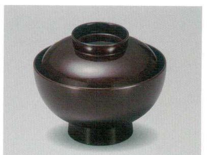
溜 仙才吸物椀 木合 硬 耐熱

5026-08 ¥2,500 φ12.0×10.0(7.0) 370ml 段無 11-0181