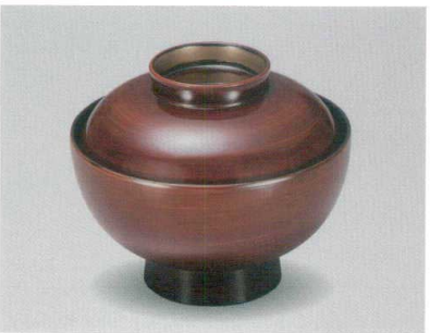
栃 立金 仙才吸物椀 木合 ウ 耐熱

5026-09 ¥2,100 φ12.0×10.0(7.0) 370ml 段無 11-018