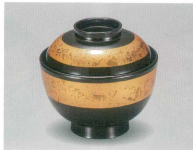
金帯箔散し 吸物椀 TA HC 耐熱

5026-01 ¥4,500 φ11.0×9.2(6.6) 285ml 13-0891