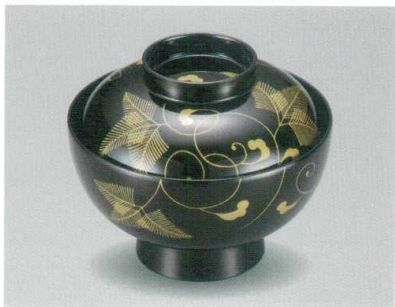
金 シダ唐草 吸物椀 木合 HC 耐熱

5026-03 ¥4,350 φ12.0×10.0(7.0) 370ml 段無 11-0192