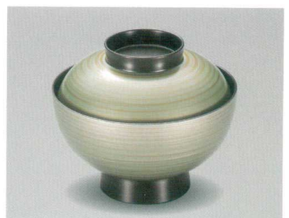
緑金かすり 仙才吸物椀 木合 HC 耐熱

5026-05 ¥3,800 φ11.8×10.1(7.0) 270ml 13-0765