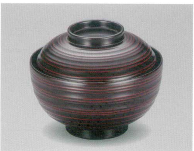
曙 乱筋吸物椀 木合 硬 耐熱

5026-10 ¥2,300 φ11.8×10.1(7.0) 270ml 13-0791