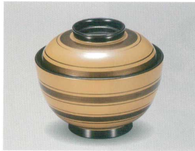
いぶし金線こま塗 吸物椀 TA HC 耐熱

5026-01 ¥4,500 φ11.0×9.2(6.6) 285ml 13-0891