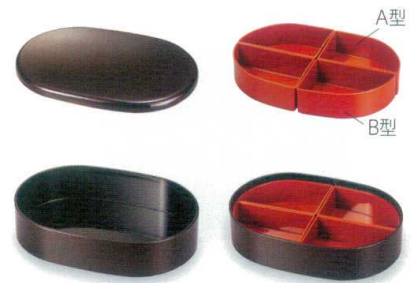
85小判重 赤中子 A型2ヶ+B型2ヶ(組) A 5270-15 24.5×16.4×4.2 85-780-3 A型・B型 各¥300×4ヶ ¥1,200