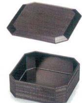
総黒 焼杉重 親 A ウ 5270-25 4寸 12.1×12.1×4.5 63-546-409 ¥850 5270-26 5寸 15.1×15.1×5.5 63-546-509 ¥1,000 5270-27 6寸 18.7×18.7×5.8 63-546-609 ¥1,400