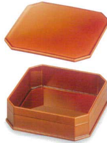
総春慶 (漆風塗) 55縁高重 親 A SH 5270-02 17.2×17.2×5.5 63-449-2 ¥3,400