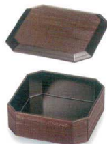
溜内黒 焼杉重 親 A ウ 5270-19 4寸 12.1×12.1×4.5 63-548-409 ¥900 5270-20 5寸 15.1×15.1×5.5 63-548-509 ¥1,100 5270-21 6寸 18.7×18.7×5.8 63-548-609 ¥1,500