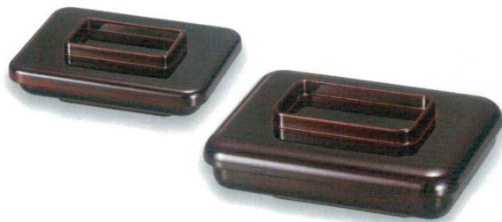
溜 (漆風塗) 内朱 うなぎ平 (A) SH ¥3,400 5284-14 小 16.8×12.5×6.0(15.2×10.9×2.8) 65-418-1 5284-15 大 18.8×14.0×6.0(16.5×11.7×2.8) 65-418-2