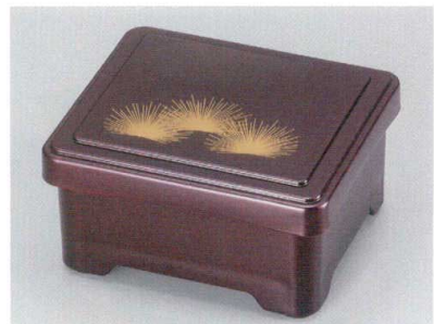
溜三階松金散らし内朱 ミニ弁重 (親爪有) (TA) HC 耐熱 ¥2,380 5284-06 13.8×12.1×7.3(12.1×10.3×4.5) 65-4851