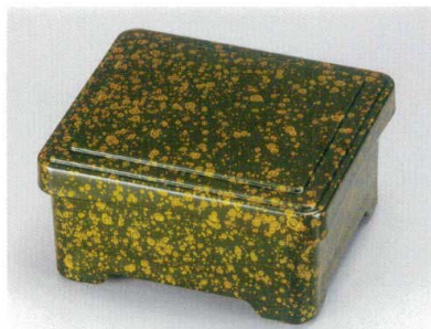
金津軽 ミニ弁重 (親爪有) (TA) ウ 耐熱 ¥2,680 5284-05 13.8×12.1×7.3(12.1×10.3×4.5) 65-484