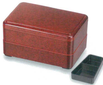
後藤塗内黒 江戸弁当 5284-07 蓋 16.9×11.3×1.8 (A) ウ ¥900 5284-08 親 (爪有) 16.9×11.3×3.9 (A) ウ ¥1,100 5284-09 仕切 10.4×7.5×2.8 (A) ¥280 5284-10 二段 (仕切別) 16.9×11.3×8.8 (A) ウ ¥3,100 63-7231-1 63-7231-2 63-723-3