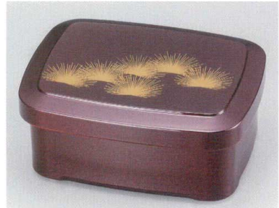
溜三階松金散らし 胴張弁重 (親爪有) (A) HC ¥2,300 5284-03 17.3×13.5×7.4(15.2×11.4×4.0) 65-507-51