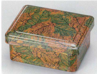
木の葉 弁重 (親回り足) (A) HC ¥4,200 5284-02 16.5×13.1×9.1(14.3×11.0×4.3) 65-503-02