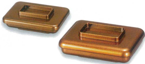
梨地内朱 うなぎ平 (A) ウ ¥1,800 5284-16 小 16.8×12.5×6.0(15.2×10.9×2.8) 65-415-1 5284-17 大 18.8×14.0×6.0(16.5×11.7×2.8) 65-415-2