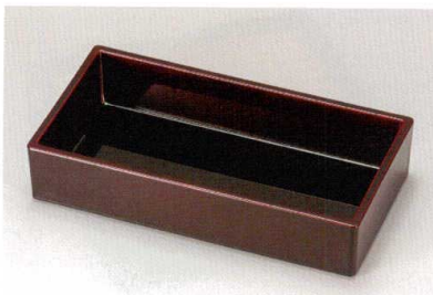
総溜 (漆風塗) 裏黒 長角箱重 (TA) SH 耐熱

5186-08 21.9×11.4×4.4 66-409-08 ¥3,400 竹す (竹) 輪