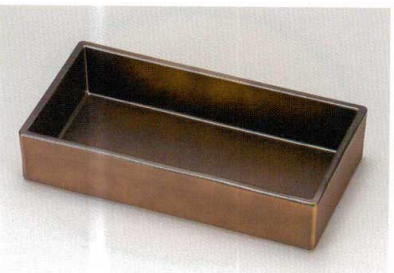
総紫檀 長角箱重 (TA) ウ 耐熱

5186-10 21.9×11.4×4.4 66-409-11 ¥2,700 竹す (竹) 輪