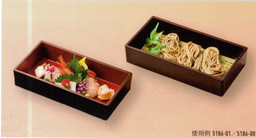
使用例 5186-01 / 5186-08