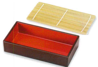
溜内朱 (漆風塗) 裏黒 箱重 (TA) SH 耐熱

5186-05 21.9×11.4×4.4 66-409-07 ¥3,400 竹す (竹) 輪