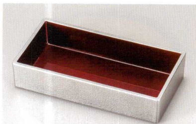
銀石目内ワイン (漆風塗) 裏黒 長角箱重 (TA) SH 耐熱

5186-02 21.9×11.4×4.4 66-409-10 ¥5,000 竹す (竹) 輪