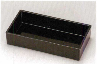
総黒 長角箱重 (TA) ウ 耐熱

5186-12 21.9×11.4×4.4 66-409-61 ¥2,100 竹す (竹) 輪