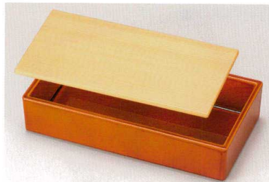
総春慶 (漆風塗) 裏黒 箱重 (TA) SH 耐熱

5186-03 21.9×11.4×4.4 66-409-09 ¥3,500 杉蓋 (汚れ止加工) (木) ウ