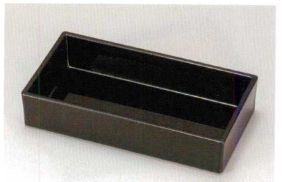
総黒 (漆風塗) 裏黒 長角箱重 (TA) SH 耐熱

5186-09 21.9×11.4×4.4 66-409-06 ¥3,200 竹す (竹) 輪