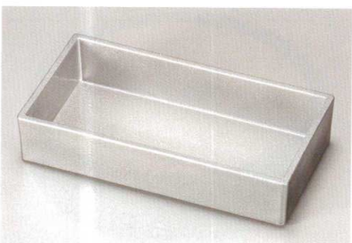
総銀石目裏黒 長角箱重 (TA) HC 耐熱

5186-07 21.9×11.4×4.4 66-409-05 ¥3,600 竹す (竹) 輪