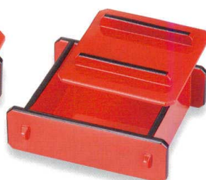
総朱天黒 底付角せいろ

5289-05 4寸 蓋 11.1x11.1x2.2 ¥850 66-371-71 5289-06 4寸 本体 13.3x11.8x4.7 ¥1,400 66-371-72 5290-07 竹角す (竹) ¥350 9.0x9.0 66-371-9