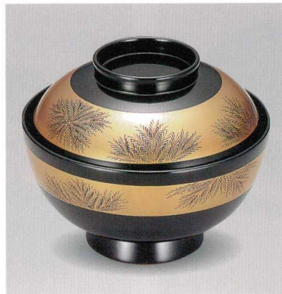
金帯 信夫沈金 吸物椀