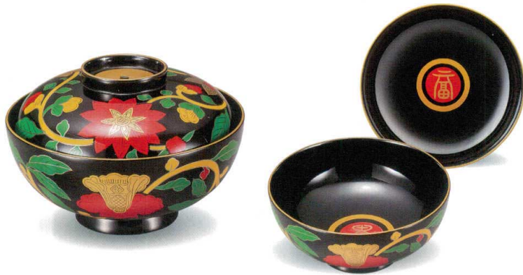
富貴 金欄手 吸物椀

5003-01 盛 時絵 φ12.8×8.7(6.0) 10-3216 5003-02 平 時絵 φ12.8×8.7(6.0) 10-3213