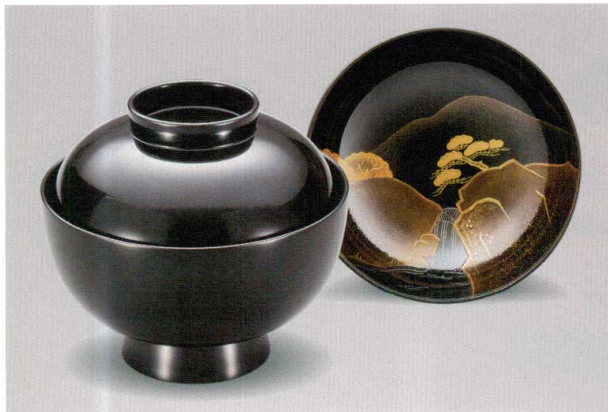
見返 山水 吸物椀