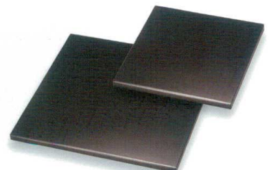
板 [木] 漆 5310-66 小 28.8×28.8×1.8 90-120 ¥21,000 5310-67 大 42.5×42.5×1.8 90-121 ¥57,000