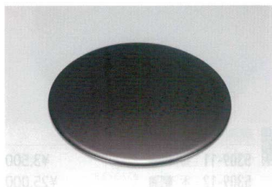
丸蛤板 [木] 漆 5310-61 φ32.1×0.9 90-115 ¥22,500