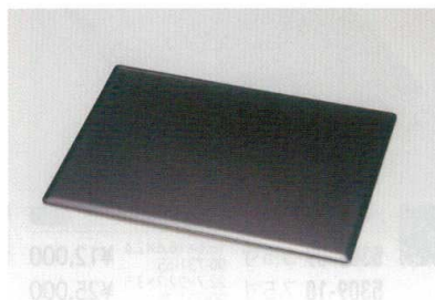
角蛤板 [木] 漆 5310-62 41.0×28.9×0.8 90-116 ¥24,000