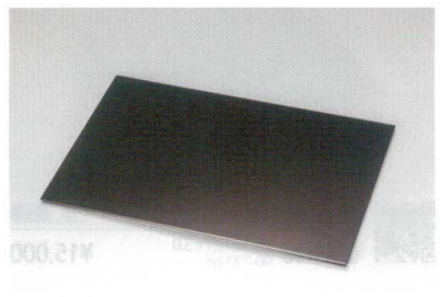
矢筈板 [木] 漆 5310-63 43.8×28.8×0.8 90-117 ¥24,000