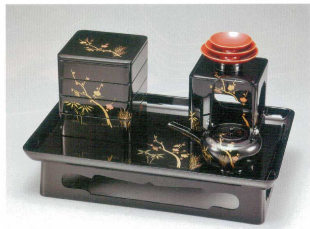
黒 松竹梅蒔絵 五ツ揃 屠蘇器 [木] 漆 5318-04 54.5×35.0×32.0 88-151-51 ¥480,000