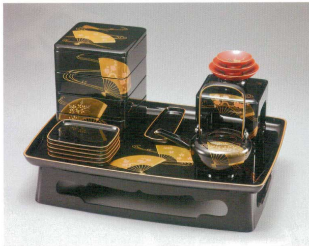
黒 扇面 七ツ揃 屠蘇器 (桐箱入) [木] 漆 5318-01 53.0×36.5×32.0 88-0711 ¥1,200,000