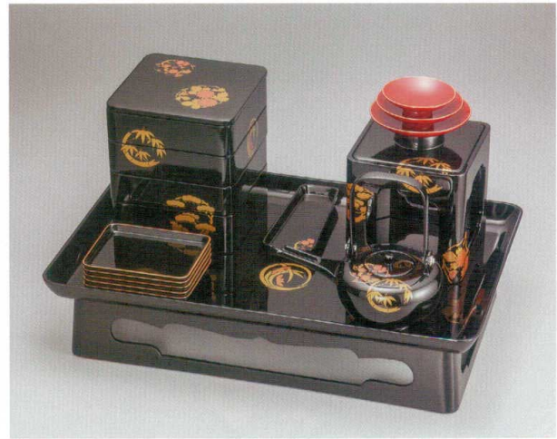
黒 花丸 七ツ揃 屠蘇器 [木] 漆 5318-02 54.5×35.0×32.0 88-151-82 ¥750,000