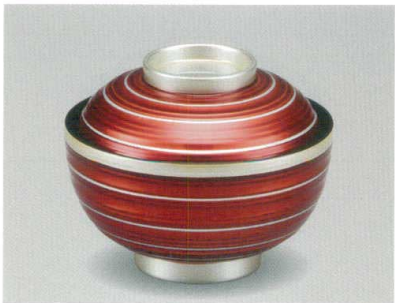
ワインに銀線 40乱筋椀 木合 HC 耐熱

5032-07 ¥4,800 φ11.8×9.4(6.7) 255ml 11-809-92