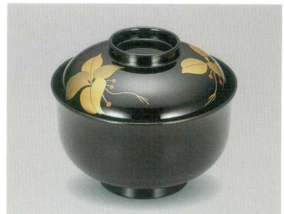
菫こうじ 天平椀 木合 HC 耐熱

5032-03 ¥4,800 φ11.4×9.1(6.6) 295ml 11-819-4