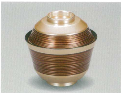
銀帯溜 乱青椀 木合 HC 耐熱

5032-08 ¥4,800 φ11.0×10.6(7.3) 295ml 11-7891