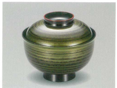
わさび塗 吸物椀 木合 HC 耐熱

5032-06 ¥4,300 φ11.0×9.6(6.8) 255ml 11-804-1