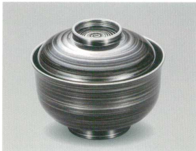
総銀渦 38天平椀 木合 SH 耐熱

5032-04 ¥4,300 φ11.4×9.1(6.6) 295ml 11-819-2