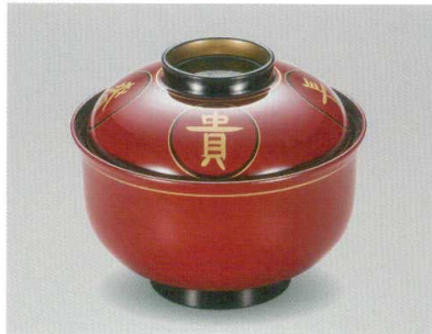
朱 富貴長春 天平椀 木合 HC 耐熱

5032-02 ¥4,800 φ11.4×9.1(6.6) 295ml 11-819-5