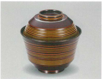
春慶 乱青椀 木合 SH 耐熱

5032-10 ¥3,000 φ11.0×10.6(7.3) 295ml 11-785