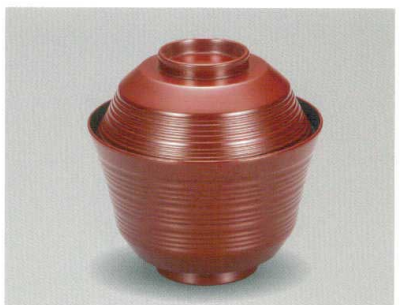
茜内黒 乱青椀 木合 硬瓷 耐熱

5032-12 ¥2,350 φ11.0×10.6(7.3) 295ml 11-787