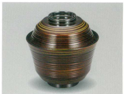
溜 金線 乱青椀 木合 HC 耐熱

5032-09 ¥4,500 φ11.0×10.6(7.3) 295ml 11-7893