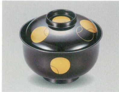
壺々 38天平椀 木合 HC 耐熱

5032-01 ¥4,800 φ11.4×9.1(6.6) 295ml 11-819-3