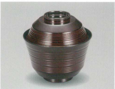
溜 乱青椀 木合 硬瓷 耐熱

5032-11 ¥2,800 φ11.0×10.6(7.3) 295ml 11-788