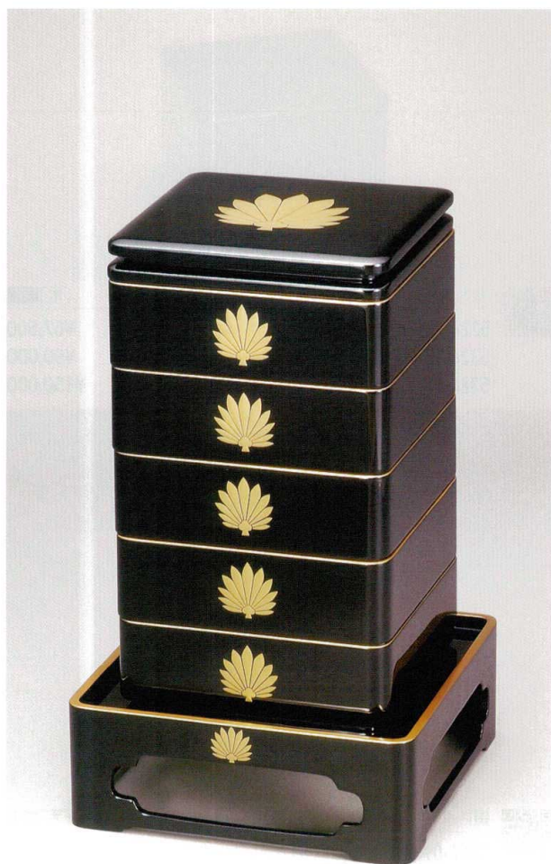
盛上紋付 75重 (蓋2枚、高台付) (木箱入) 木 漆 5323-01 五段 重 23.0×23.0×39.6、台 29.0×29.0×10.6 84-1758-51 ¥1,500,000 5323-02 四段 重 23.0×23.0×32.6、台 29.0×29.0×10.6 84-1758-41 ¥1,350,000