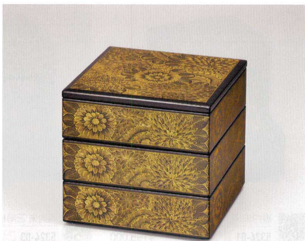
菊詰め沈金 70三段本重 木 漆 5323-03 21.5×21.5×21.3 84-5703-11 ¥300,000