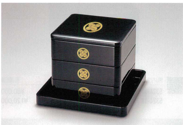
磨家紋入 65三段重 (木箱入) 木 漆 5323-04 19.7×19.7×19.2 84-1653-91 ¥180,000 総黒 65隅丸重 平台 木 漆 5324-15 25.8×25.8×3.0 84-0165 ¥24,000