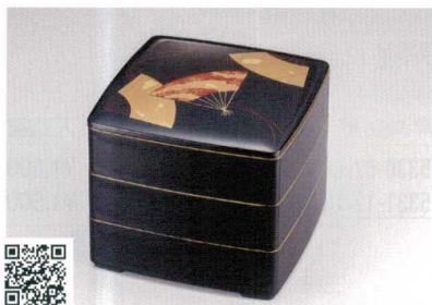
黒内朱天金 扇面 胴張重 A ウ 5329-07 65蓋 19.5×19.5×1.4 85-1641-651 ¥1,800 5329-08 65親 19.5×19.5×5.3 85-1641-659 ¥1,100 (内寸 18.6×18.6×4.6) 二段 19.7×19.7×11.3 ¥4,000 三段 19.7×19.7×16.2 ¥5,100 5329-09 75蓋 22.5×22.5×1.6 85-6563-751 ¥2,000 5329-10 75親 22.5×22.5×6.4 85-6560-759 ¥1,500 (内寸 21.3×21.3×5.4) 二段 22.7×22.7×13.2 ¥5,000 三段 22.7×22.7×19.0 ¥6,500