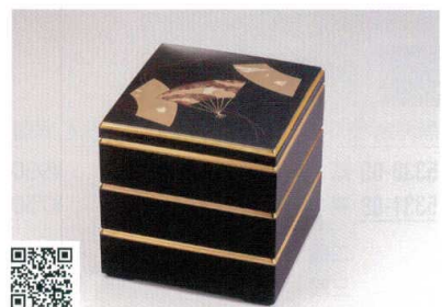
黒内朱測金 扇面 校倉重 A ウ 5329-15 65蓋 19.6×19.6×2.3 85-6362-651 ¥1,800 5329-16 65親 19.6×19.6×6.2 85-6360-659 ¥1,000 (内寸 18.8×18.8×5.3) 二段 19.6×19.6×13.5 ¥3,800 三段 19.6×19.6×19.3 ¥4,800 5329-17 75蓋 22.5×22.5×1.6 85-6362-751 ¥2,400 5329-18 75親 22.5×22.5×6.4 85-6360-759 ¥1,700 (内寸 21.6×21.6×5.6) 二段 22.5×22.5×14.2 ¥5,800 三段 22.5×22.5×20.0 ¥7,500