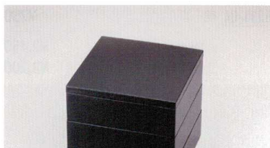
黒内朱 65宝重 A ウ 5329-23 蓋 19.6×19.6×1.5 85-7760-651 ¥900 5329-24 親 19.6×19.6×6.0 85-7760-659 ¥1,100 (内寸 18.8×18.8×5.4) 二段 19.6×19.6×13.2 ¥3,100 三段 19.6×19.6×19.0 ¥4,200