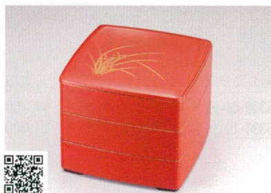
総朱天金 蘭 胴張重 A ウ 5329-11 65蓋 19.5×19.5×1.4 85-1642-651 ¥1,300 5329-12 65親 19.5×19.5×5.3 85-1642-659 ¥1,200 (内寸 18.6×18.6×4.6) 二段 19.7×19.7×11.3 ¥3,700 三段 19.7×19.7×16.2 ¥4,900 5329-13 75蓋 22.5×22.5×1.6 85-6572-751 ¥1,600 5329-14 75親 22.5×22.5×6.4 85-6570-759 ¥1,500 (内寸 21.3×21.3×5.4) 二段 22.7×22.7×13.2 ¥4,600 三段 22.7×22.7×19.0 ¥6,100