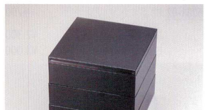
黒内朱 70宝重 A ウ 5329-25 蓋 21.2×21.2×1.8 85-7760-701 ¥1,000 5329-26 親 21.2×21.2×6.0 85-7760-709 ¥1,250 (内寸 20.4×20.4×5.6) 二段 21.2×21.2×13.5 ¥3,500 三段 21.2×21.2×19.3 ¥4,750