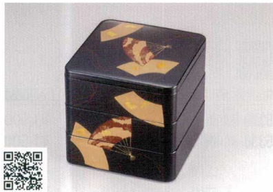
黒内朱 扇面 測厚DX三段重 A ウ 5329-01 65 19.6×19.6×19.0 85-7361-653 ¥8,000 (内寸 18.3×18.3×5.2) 5329-02 75 22.9×22.9×18.7 85-7361-753 ¥9,000 (内寸 19.8×19.8×4.8)