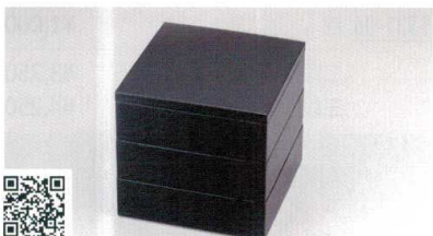
黒内朱 宝重 A ウ 5329-19 55蓋 16.5×16.5×1.7 85-7760-551 ¥900 5329-20 55親 16.5×16.5×5.2 85-7760-559 ¥950 (内寸 15.7×15.7×4.7) 二段 16.5×16.5×11.8 ¥2,800 三段 16.5×16.5×16.5 ¥3,750 5329-21 60蓋 18.2×18.2×1.6 85-7760-601 ¥900 5329-22 60親 18.2×18.2×5.0 85-7760-609 ¥1,050 (内寸 17.4×17.4×4.5) 二段 18.2×18.2×11.0 ¥3,000 三段 18.2×18.2×15.7 ¥4,050