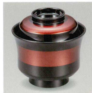
白檀帯 30石州小吸椀 木合 硬 耐熱 5061-10 ¥2,000 φ8.8×8.3(6.6) 160ml 15-106