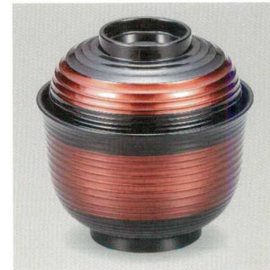
白檀帯 33羽反乱筋椀 木合 硬 耐熱 5061-16 ¥2,000 φ10.0×10.0(8.8) 245ml 16-0561