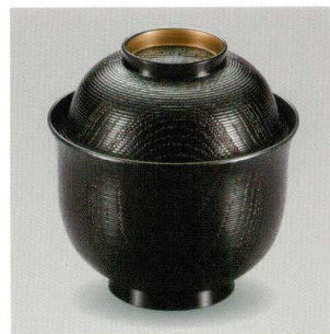
黒 立金 糸筋木目 小吸椀 木合 硬 耐熱 5061-06 ¥1,750 φ9.5×9.9(7.0) 240ml 15-4761