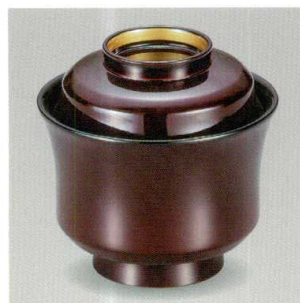
溜 立金 30石州小吸椀 木合 硬 耐熱 5061-09 ¥2,100 φ8.8×8.3(6.6) 160ml 15-1081