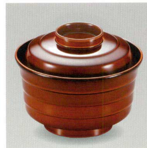
春慶 33段々椀 木合 硬 耐熱 5061-14 ¥2,800 φ10.0×7.8(6.1) 205ml 15-465