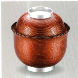
銀帯溜 糸筋木目 小吸椀 木合 HC 耐熱 5061-01 ¥2,300 φ9.5×9.9(7.0) 240ml 15-4751