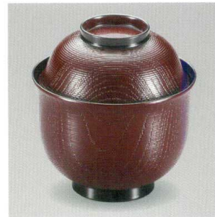
茜塗分 糸筋木目 小吸椀 木合 硬 耐熱 5061-08 ¥1,750 φ9.5×9.9(7.0) 240ml 15-4794