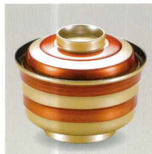
銀帯溜 33段々椀 木合 HC 耐熱 5061-13 ¥2,800 φ10.0×7.8(6.1) 205ml 15-4691