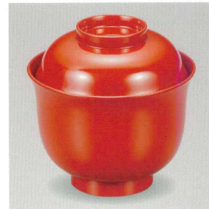
総洗朱 31姫小吸椀 木合 硬 耐熱 5061-12 ¥2,100 φ9.5×9.4(6.9) 220ml 15-157