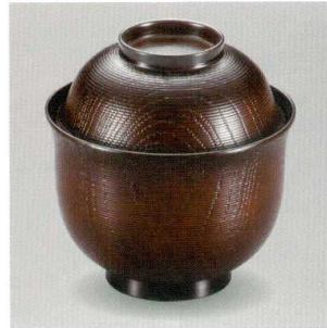
栃塗 糸筋木目 小吸椀 木合 ウ 耐熱 5061-03 ¥2,100 φ9.5×9.9(7.0) 240ml 15-4791