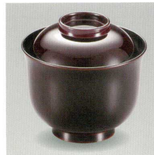
溜 30姫小吸椀 木合 硬 耐熱 5061-11 ¥2,100 φ8.9×8.7(6.8) 195ml 15-168