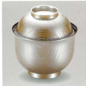
銀地 糸筋木目 小吸椀 木合 HC 耐熱 5061-02 ¥2,100 φ9.5×9.9(7.0) 240ml 15-4793