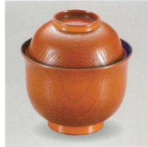
春慶 糸筋木目 小吸椀 木合 ウ 耐熱 5061-04 ¥1,800 φ9.5×9.9(7.0) 240ml 15-474