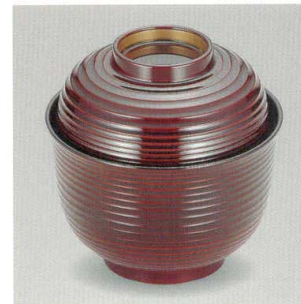
溜 立金 33羽反乱筋椀 木合 硬 耐熱 5061-15 ¥2,100 φ10.0×10.0(8.8) 245ml 16-0581