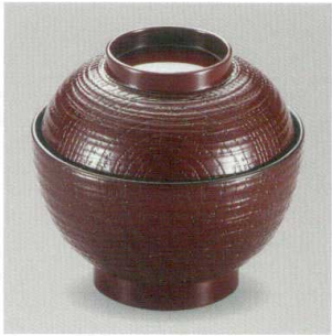
ウルミ 樺木目 33小吸椀 5062-12 A ウ ¥980 φ10.0×9.5(6.4) 250ml 17-225 5062-13 TA ウ 耐熱 ¥1,180 φ10.0×9.5(6.4) 250ml 17-225-9