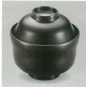
黒 荒目 35ヒサゴ小吸椀 A ウ 5062-03 ¥1,950 φ10.4×10.3(7.0) 280ml 11-3291