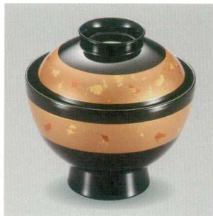
金帯箔散 35京小吸椀 TA HC 耐熱 5062-05 ¥3,000 φ10.3×10.1(7.3) 220ml 17-702-1