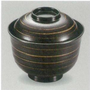
黒 金線荒目 羽反小吸椀 A ウ 5062-08 ¥2,100 φ9.8×9.0(6.6) 215ml 15-808-2