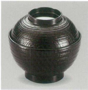
黒 樺木目 33小吸椀 5062-14 A ウ ¥980 φ10.0×9.5(6.4) 250ml 17-226 5062-15 TA ウ 耐熱 ¥1,180 φ10.0×9.5(6.4) 250ml 17-226-9