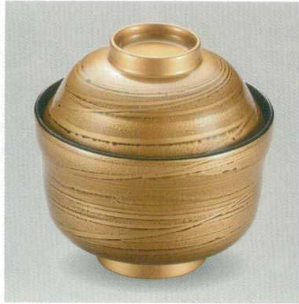
金 荒目 35ヒサゴ小吸椀 A HC 5062-02 ¥2,500 φ10.4×10.3(7.0) 280ml 11-3292