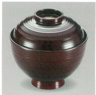
溜 刷毛目 33小吸椀 樹 ウ 耐熱 5062-11 ¥2,150 φ10.0×9.7(6.7) 240ml 16-208-33