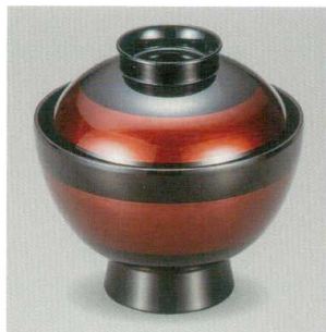
白檀 帯 35京吸物椀 TA 硬 耐熱 5062-06 ¥1,950 φ10.3×10.1(7.3) 220ml 17-702-2