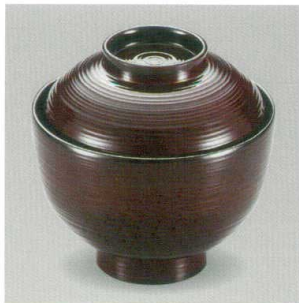
溜 刷毛目 30小吸椀 TA ウ 耐熱 5062-10 ¥1,800 φ9.3×9.0(6.4) 175ml 16-208-30