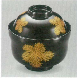
信夫 35ヒサゴ小吸椀 A ウ 5062-01 ¥2,600 φ10.4×10.3(7.0) 280ml 11-3261