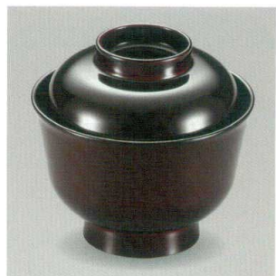
溜 34ゆり形小吸椀 TA SH 耐熱 5062-07 ¥2,600 φ10.2×9.8(7.0) 235ml 11-811-8