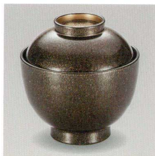
黒 銀砂子立金 32小吸椀