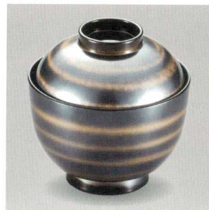
黒銀 金輪 31小吸椀