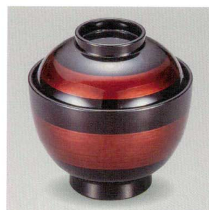
白檀 帯 32小吸椀