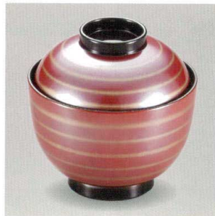
朱銀 金輪 31小吸椀