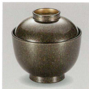
黒 銀砂子立金 31小吸椀