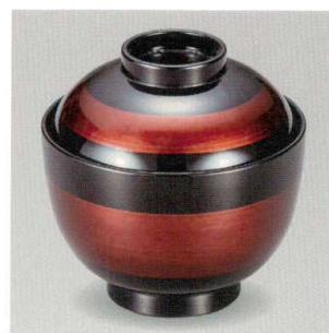
白檀 帯 31小吸椀