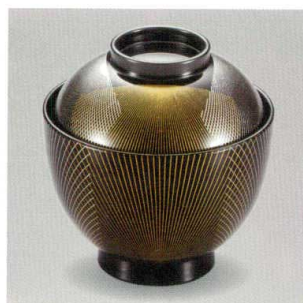
黒 新武蔵野 32小吸椀