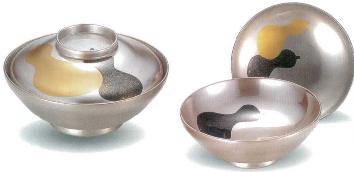
銀地 六瓢 45平かすみ椀