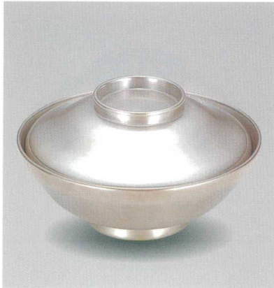
総銀地 45平かすみ椀