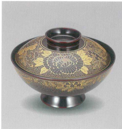
溜 秋草沈金 御殿椀