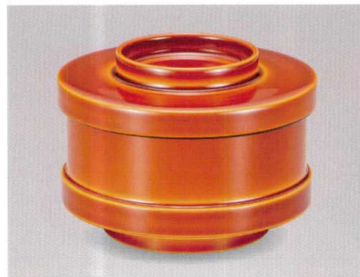
春慶 提灯お好み椀