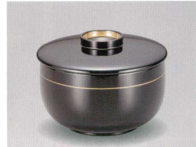
総黒 金帯 ほてい椀