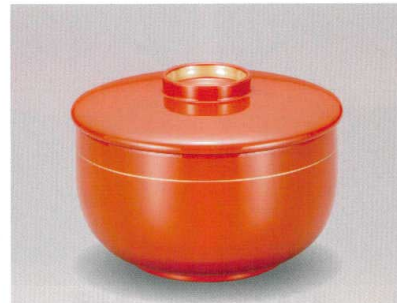
総朱 金帯 ほてい椀