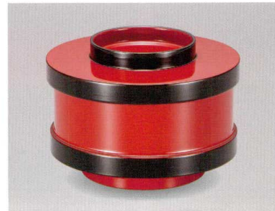
朱帯黒 提灯お好み椀