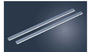
③アクリル ケーキカッター ルーラー (2本1組)