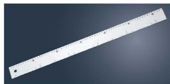
⑫テルモハウザー ドゥルラーソフトタイプ 44051