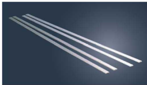
①EBM 18-8 パウル棒 (2本1組)