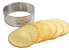
⑥18-8 ケーキスライサー No.1726