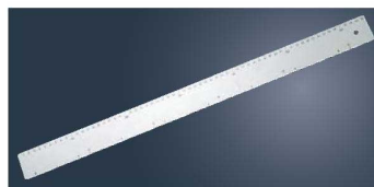
⑬テルモハウザー ドゥルラーハードタイプ 44061