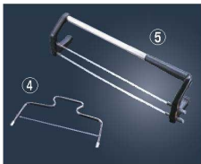
④ケーキスライサー No.1311