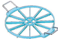
⑩PC スポンジ マーカー