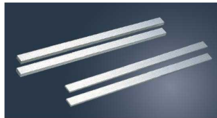
②アルミ ケーキカッター ルーラー (2本1組)

●パウル棒をスポンジの両サイドに置き、ナイフを滑らせるようにカットします。色々な厚みのケーキを切る事ができます。