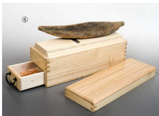
06 (402644) 鯉節削り器(M) ¥15,000 本体寸法:W27xD9.5xH10.7cm 木 ステンレス