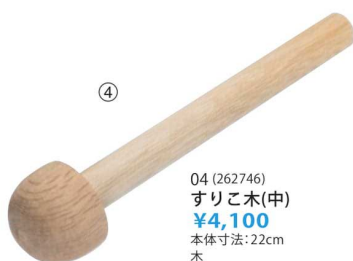
04 (262746) すりこ木(中) ¥4,100 本体寸法:22cm 木