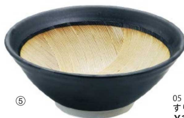
05 (40572) すり鉢(黒)(7号) ¥1,500 本体寸法:Φ22xH9.1cm 陶器