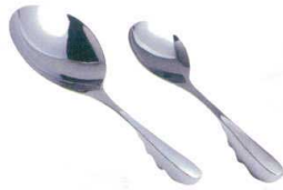
12 ののじ 18-8 スーパーオタモ [BOTM-02] ◇E

サイズ 全長 大 LTM-H02 147 373 13-0197-1101 ¥3,200 小 LTM-H01 102 310 13-0197-1102 ¥1,800 重量:大/220g 小/125g パンチング穴径:3