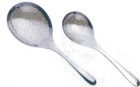
11 ののじ 18-8 穴明オタモ [BOTM-03] ◇E

サイズ 全長 大 LTM-HU02 147 373 13-0197-1001 ¥5,200 小 LTM-HU01 102 310 13-0197-1002 ¥3,200 重量:大/270g 小/170g パンチング穴径:3 ●柄は手にフィットする中空立体グリップ。