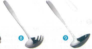
8 ののじ 18-8 ニードル杓子 [BRDL-18] ◇E

13-0197-0501 ¥900 サイズ:130×62 重量:45g ●付け合わせの盛り付けにぴったりなサイズです。