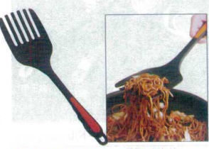
17 ののじ マゼモ・モコモコ LTM-MN01 [BOTM-07] E

13-0197-1601 ¥800 サイズ:135×全長365 重量:105g 耐熱温度:200°C ●水切れの良い大穴で、少量の食材の茹で上げに最適です。