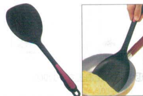
14 ののじ ペタモ・モコモコ LTM-PN01 [BOTM-04] E

13-0197-1401 ¥800 サイズ:120×全長350 重量:92g 耐熱温度:200°C ●天板から吸い付く様にすくい上げれます。