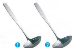
1 ののじ 18-8 お玉 80cc [BOTA-15] ◆E

フック付 LB-FS001 13-0197-0101 ¥1,700 フック無 LB-NS001 13-0197-0102 ¥1,700 サイズ:φ90×柄230 重量:130g