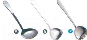
5 ののじ 18-8 プチお玉 20cc LB-NS051 [BOTA-25] E

フック付 LB-FS020 13-0197-0301 ¥2,300 フック無 LB-NS020 13-0197-0302 ¥2,300 サイズ:φ90×柄230 重量:115g