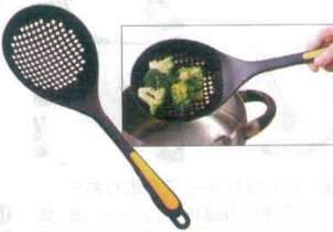
16 ののじ アミオタモ・モコモコ LTM-HN01 [BOTM-06] E

13-0197-1501 ¥800 サイズ:100×全長335 重量:80g 耐熱温度:200°C ●柄とお玉部分が平行になっているので、「すくって→ようそう」動作がスムーズに入ります。