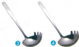
3 ののじ 18-8 歯付きお玉 80cc [BOTA-13] ◆E

フック付 LB-FS001 13-0197-0101 ¥1,700 フック無 LB-NS001 13-0197-0102 ¥1,700 サイズ:φ90×柄230 重量:130g