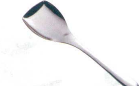
13 ののじ 18-8 バットサーバー LBS-S010 [BTAN-34] E

サイズ 全長 大 LTM-SU02φ147 373 13-0197-1201 ¥4,500 小 LTM-SU01φ90 300 13-0197-1202 ¥2,500 容量:大/400cc 小/55cc 重量:大/310g 小/185g ●柄は手にフィットする中空立体グリップ。