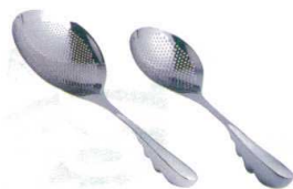
10 ののじ 18-8 スーパー穴明きオタモ [BOTM-01] ◆E

サイズ 全長 大 LTM-HU02 147 373 13-0197-1001 ¥5,200 小 LTM-HU01 102 310 13-0197-1002 ¥3,200 重量:大/270g 小/170g パンチング穴径:3 ●柄は手にフィットする中空立体グリップ。