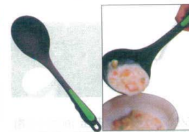
15 ののじ オタモ・モコモコ LTM-N01 [BOTM-05] E

13-0197-1401 ¥800 サイズ:120×全長350 重量:92g 耐熱温度:200°C ●天板から吸い付く様にすくい上げれます。