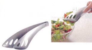
⑫ 18-0 ゆびさきサーバートング