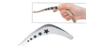
⑮ ののじ UDサーバートング