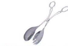
④ 18-8 サラダトング