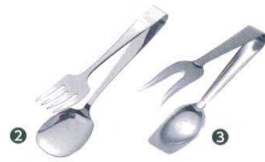
② 18-0 ホテル型サービストング 大