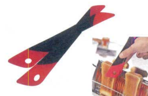
⑳ マルチトング ラズベリー