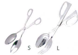
⑤ UK18-8 サーバートング