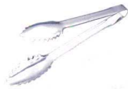
⑥ 18-0 セーフティリーフトング