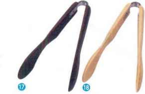
⑰ 木製 アームトング