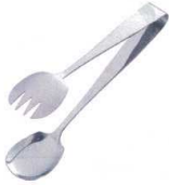
① 18-0 サラダサービストング