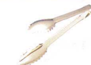
⑨ 18-0 ゴールドセーフティリーフトング