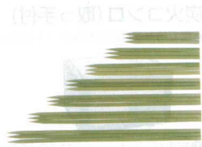
③ 竹製 平串(100本入) [ETKS-12]