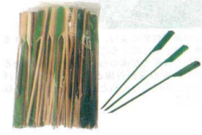
⑧ 鉄砲串(緑)(100本入) [ETKS-03]