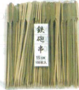
⑦ 竹製 鉄砲串(100本入) [ETKS-13]