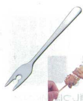
⑬ ステンレス 串とーり [IKST-01]