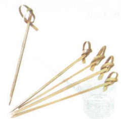
⑫ 竹製のし串(100本入) [ETKS-17]