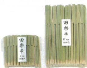
⑨ 竹製 田楽串(100本入) [ETKS-14]