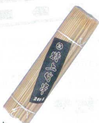
⑤ 竹串丸 (200本入) [ETKS-06]