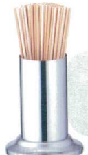
⑭ 18-8 串入れ [EKSJ-01]