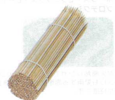
④ 徳用竹串 中丸 (200本入) [ETKS-08]