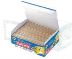
② 竹製 うなぎ串(箱入1kg)