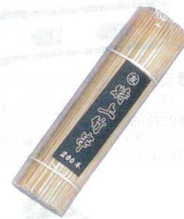
⑥ 竹串角 (200本入) [ETKS-07]