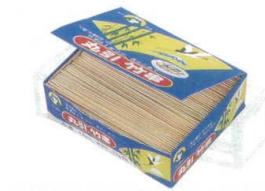
① 竹製 丸串(箱入1kg)