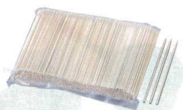
⑩ 竹製 海老串(袋入1,000本入) [ETKS-11]