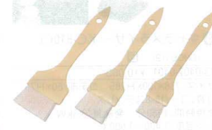
8 プラ柄 ナイロンハケ [HHKE-06] △