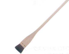
10 江戸前ハケ (馬毛) [HHKE-21] △