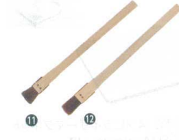
11 竹柄 小物ハケ (馬毛) [HHKE-18] △