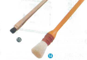
13 竹柄 寿司はけ (馬毛) [HHKE-07] △