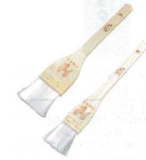
7 木曽駒印 ナイロンハケ [HHKE-05] △