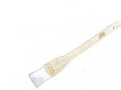
6 木曽駒印 厚口 アクリルハケ