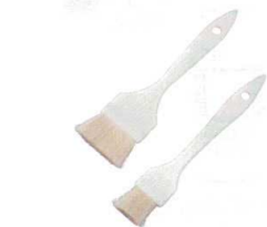
9 プラ柄 白ハケ (山羊) [HHKE-01] △