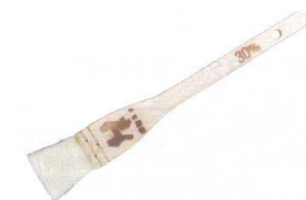
5 木曽駒印 厚口 ヤンルックハケ