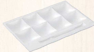
①「和」テイスト ビュッフェプレート 陶磁器調 (スーパーハード塗り) 白